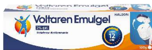
VOLTAREN EMULGEL 2% GEL 100 g