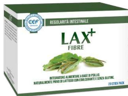
LAX+ FIBRE 20 stick pack