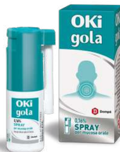
OKI GOLA 0,16% SPRAY 15 ml

CONTINUA LA PROMOZIONE DI DICEMBRE VALIDA FINO AL 31 GENNAIO 2026