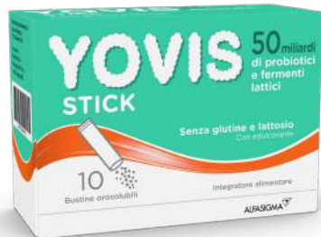
YOVIS • Stick 10 bustine orosolubili • Caps 10 capsule da 0,7 g