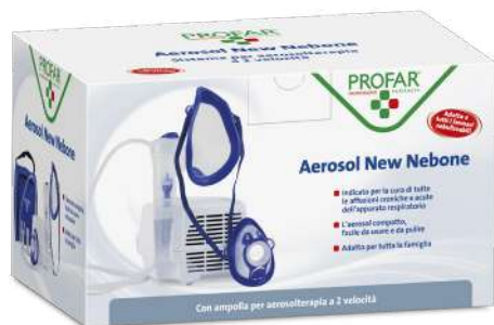
AEROSOL NEW NEBONE