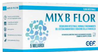
MIX B FLOR 12 flaconcini