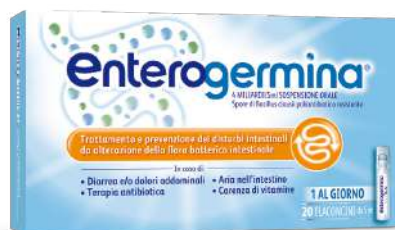
ENTEROGERMINA 4 MILIARDI/5 ml SOSPENSIONE ORALE 20 flaconcini da 5 ml