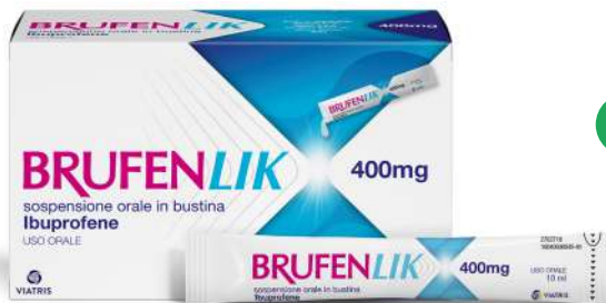
BRUFENLIK 400 mg 20 bustine da 10 ml