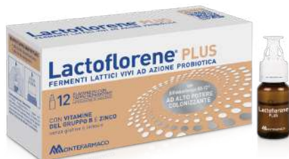
LACTOFLORENE PLUS 12 flaconcini