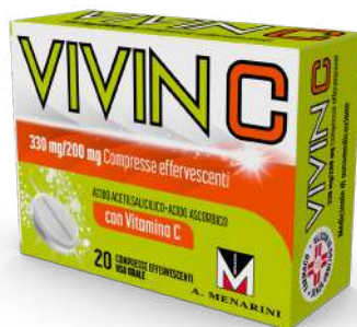
VIVIN C 330 mg / 200 mg 20 compresse effervescenti

CONTINUA LA PROMOZIONE DI DICEMBRE VALIDA FINO AL 31 GENNAIO 2026