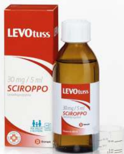
LEVOTUSS 30 mg / 5 ml SCIROPPO 200 ml