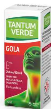
TANTUM VERDE GOLA 250 mg / 100 ml Spray 15 ml