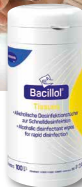
Bacillol® Tissues 100 Stück

** Keine Sorge, Antragstellung ist ganz einfach, wir übernehmen alle Formalitäten für Sie!