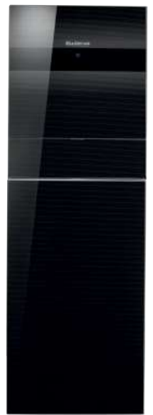
WLB196i ... IR/AR TP120