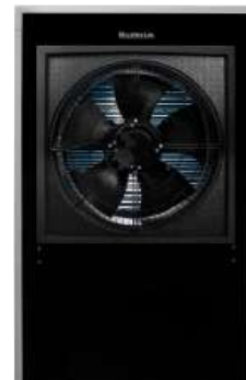
Logatherm WLW196i IR

Für die wegweisend leise Betriebsweise der neuen Logatherm WLW196i AR S+ mit 4 kW und 6 kW sorgt die SILENT plus Technologie (S+). Der Diffusor ist die augenscheinlichste Neuerung, der nicht nur technisch zur Schallreduktion beiträgt, sondern mit den grau lackierten Verkleidungsteilen auch optisch besonders ansprechend ist. So wird auch die gesetzliche Lärmschutzvorgabe nach TA Lärm in eng bebauten Wohngebieten erfüllt.