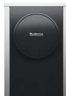
Logatherm WLW196i AR S+