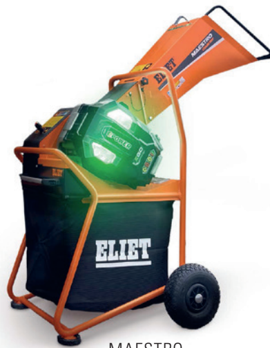
MAESTRO Country E-DC