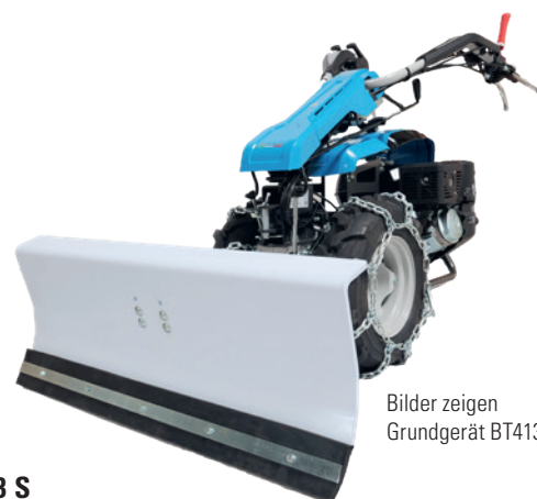
Bilder zeigen Grundgerät BT413S