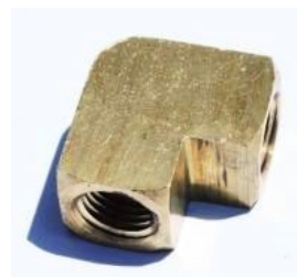
100B ELBOW - זזית פליז