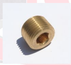
107B UNION - רקורד פליז