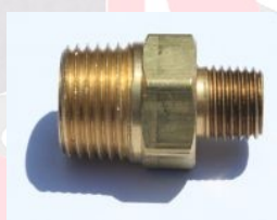
ניפל מעבר פליז חוץ חוץ - 123B