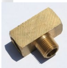
טי פליז זכר חוץ במרכז - 3600