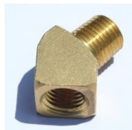
זוית פליז - 124B