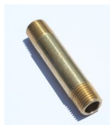
113B - LONG NIPPLE