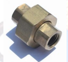
104B UNION - רקורד פליז