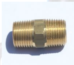
ניפל כפול פליז - 122B