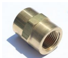
מופה מעבר פליז - B119