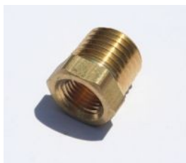
בושינג פליז - 110B