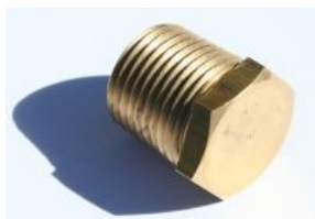
פקק פליז - 121B