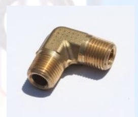
117B - זזית פליז חוץ חוץ