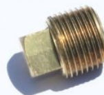
פקק פליז ראש מרובע - 109B