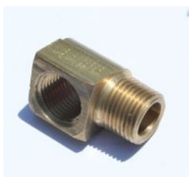
B116 - זזית פליז פנים חוץ