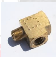
טי פליז זכר חוץ בצד - 3750