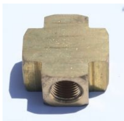
צלב פליז - 3950