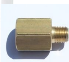
מקשר פליז פנים חוץ - 120B