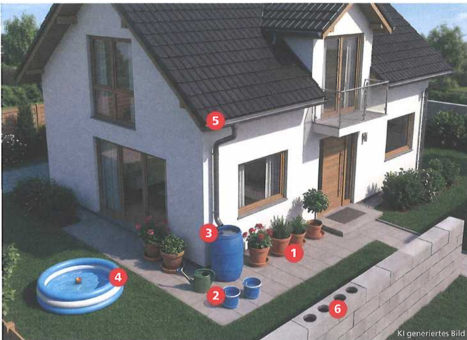
KI generiertes Bild