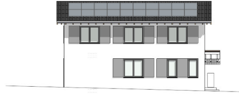
Parzelle 11 Ansicht Süden