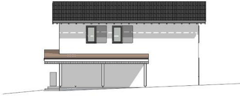
Parzelle 11 Ansicht Norden