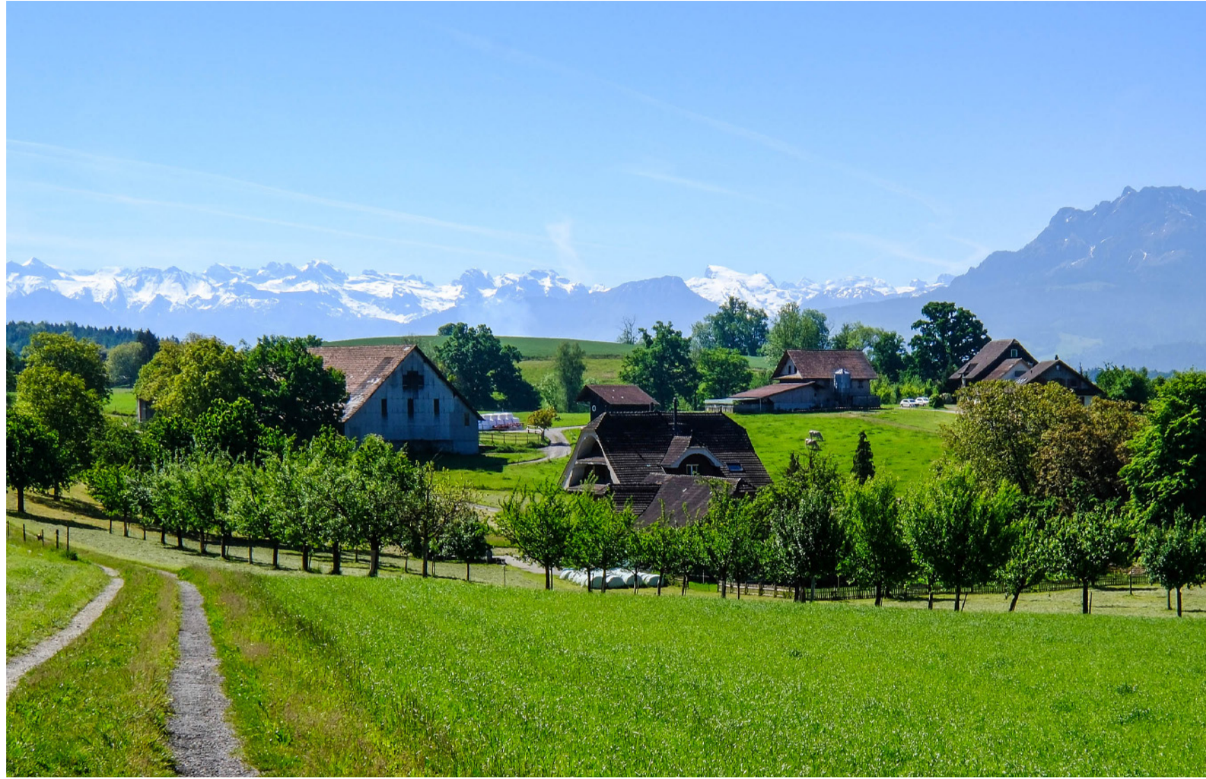
Das Hofgebiet Dachsellere mit dem Ursprungshof im mittleren Bildbereich und dem Sonnhof im Vordergrund.

SEMPACH MEHRMALS GETEILT, WIEDERVEREINIGT UND ERNEUT GETEILT