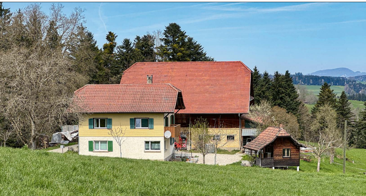
Abbildung 4: Grosslingi wurde 1958 nach einem Hagelschlag als Neusiedlung auf der Krete beim Schüdeliwald neu aufgebaut. Vorher standen die beiden Lingihöfe dicht beieinander.