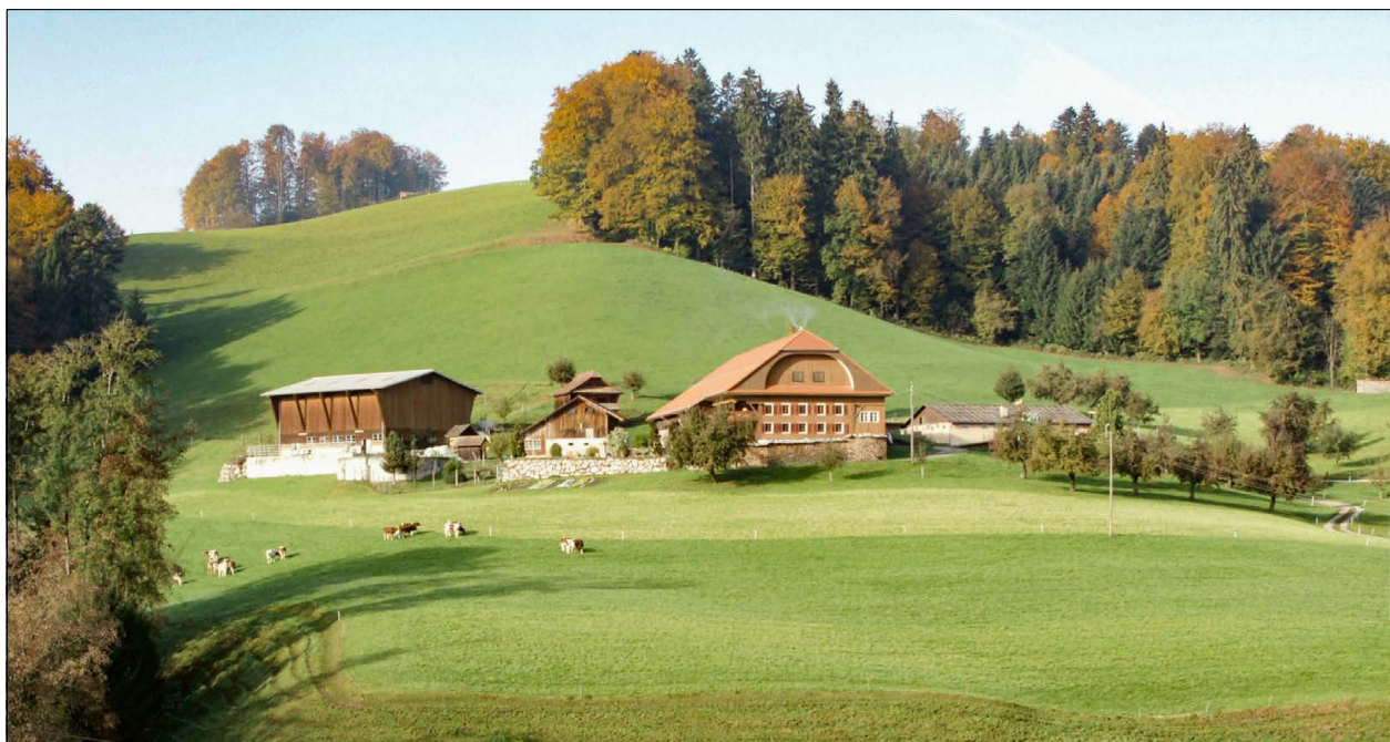
Abbildung 5: Der Kället Hof wird in einem Urbar des Stifts Beromünster von 1508 erstmals erwähnt.