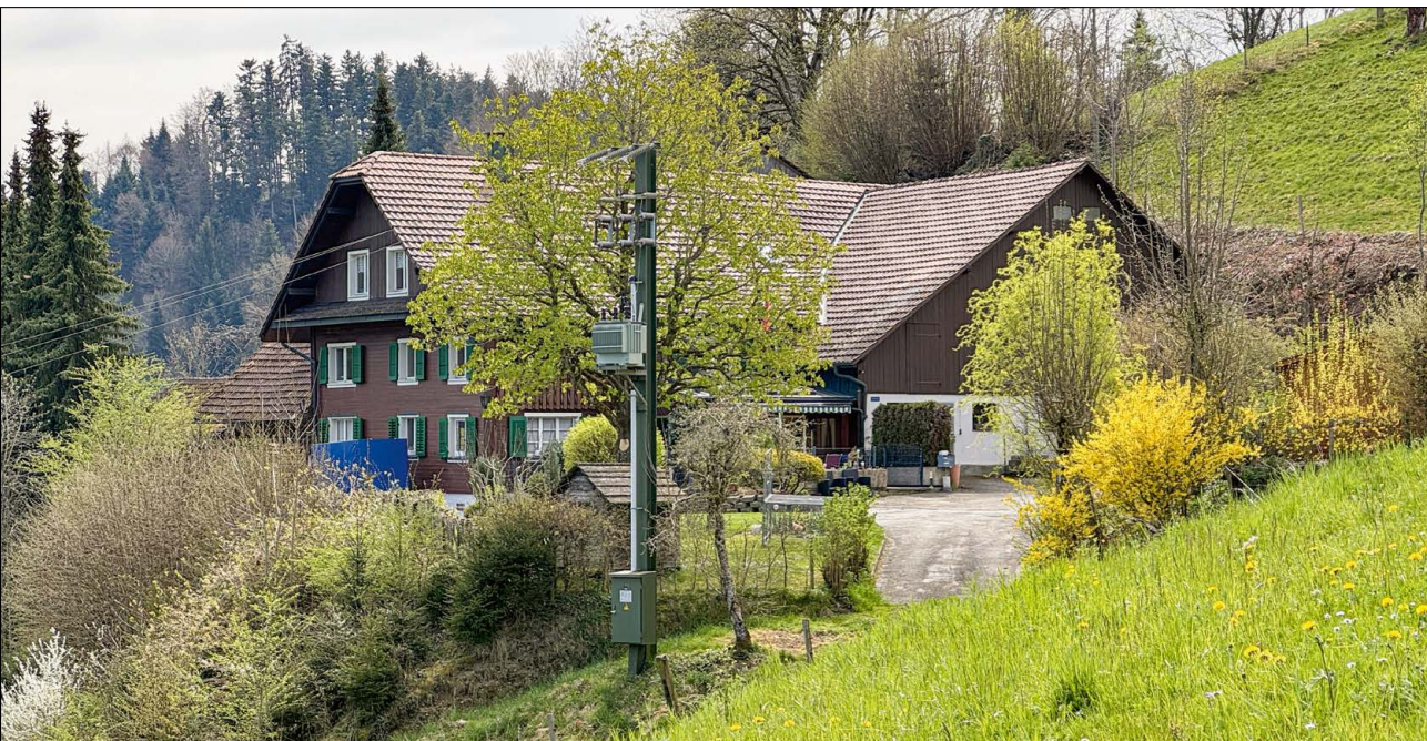
Abbildung 3: Der Hof Lingi wird in einer Gült 1544 erstmals erwähnt (hier Kleinlingi). Der Hof Grosslingi lag ursprünglich gleich daneben.

von allen Beschwerden befreit, das vernennen wir aus einer Gült von 1574. Einzig das Glockenseil der Kirche Altishofen musste unterhalten werden. Diese Reallast wurde erst 1940 abgelöst.