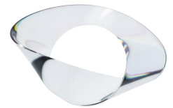
كورنيش فيو CORNICHE VIEW