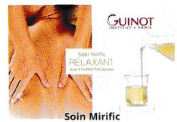
Relaxez votre corps avec le nouveau Soin Mirific !

La peau retrouve vitalité et douceur grâce aux 4 huiles précieuses. Bien-être & relaxation.