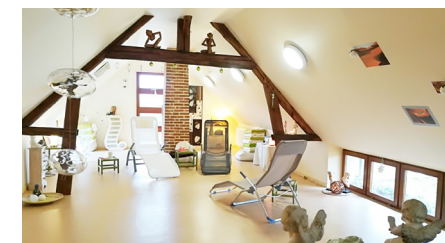
Salle de détente