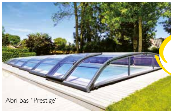
Abri bas "Prestige"