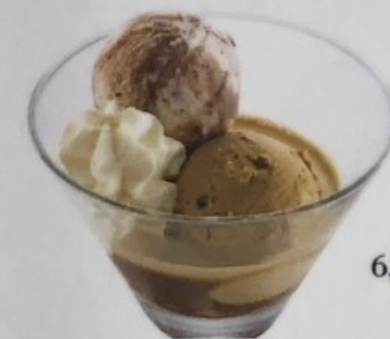
Gelati a Caffè Café, Tiramisù