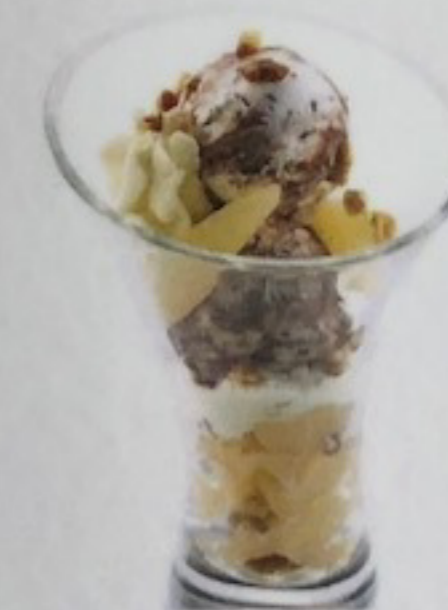
Poire Bellezza 2 b. Stracciatella, quartiers de poires, noix, crème fouettée