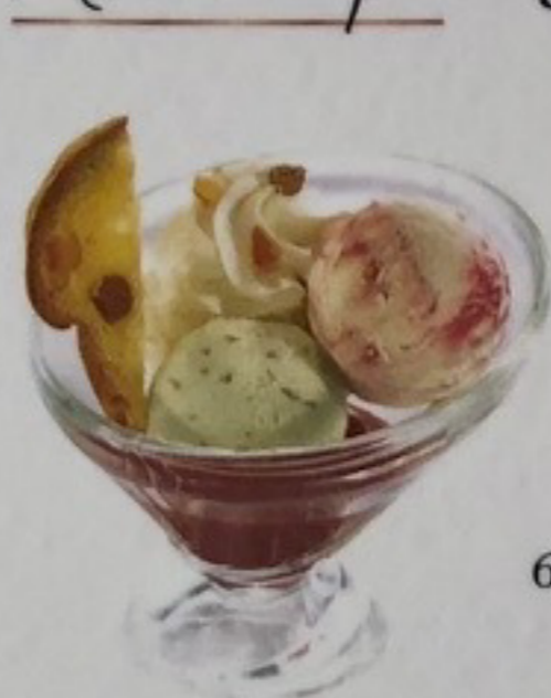
Amaren' Amore Pistache, Amarena, biscuit fruits rouges