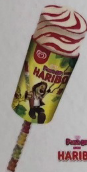
Parfum Vanille, sauce fraise avec ses célèbres Ours d'Or (4)