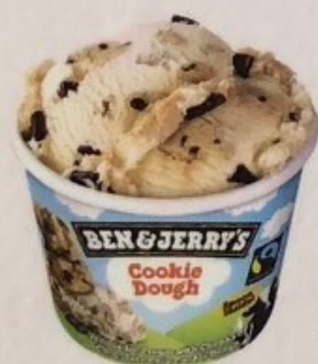
BEN & JERRY'S Vanille, Cookie