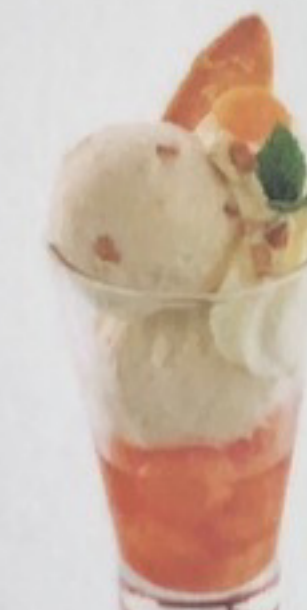
Banan'Amor 1 b. Dolcezza, 1 b. Stracciatella, 1 b. Panna, banane, crème fouettée