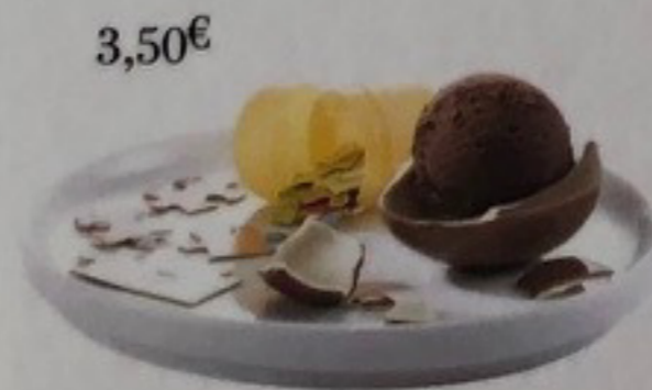
L'Œuf Surprise Chocolat