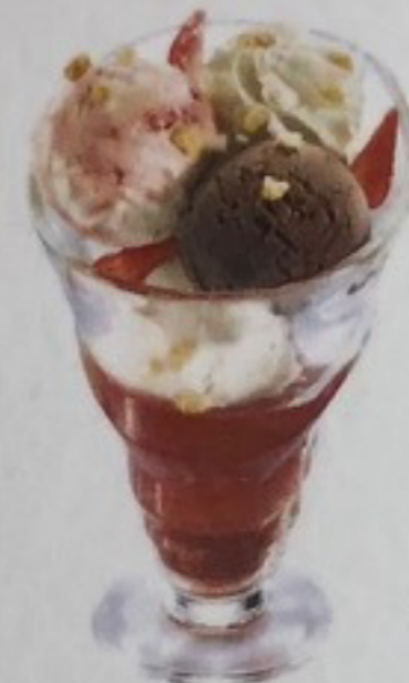
Délice du Maestro Amarena, Chocolat Noir, Chocolat Blanc, biscuit fruits rouges, crème fouettée