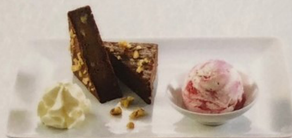
Little Italy Au choix 5,00 €