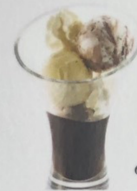
Bianca Nera 2 b. Stracciatella, 1 b. Vanille, sauce chocolat, crème fouettée