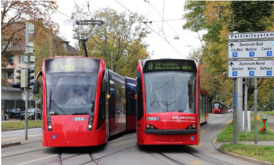
MV im Rest. Egghölzi, 15.04.2025