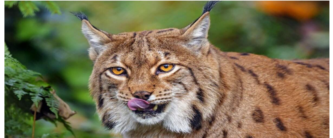
Führung im Tierpark