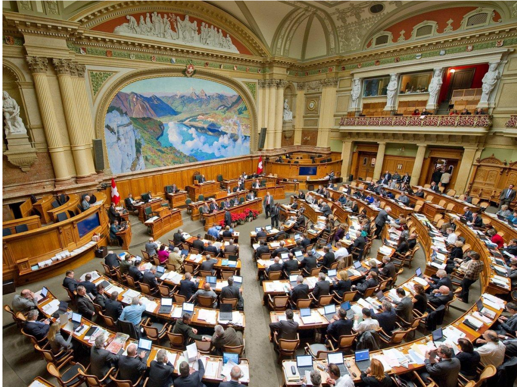
Führung im Bundeshaus