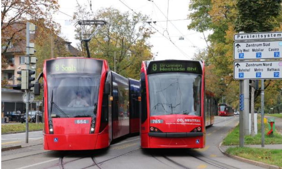
MV im Rest. Egghölzli, 15.04.2025