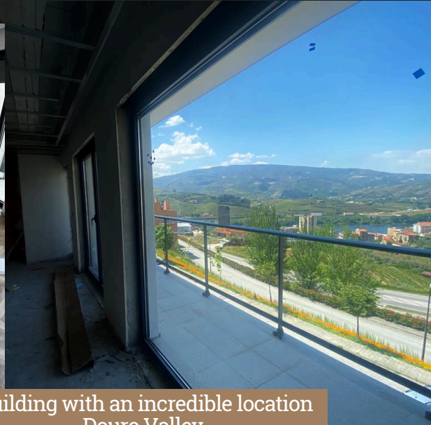
Building with an incredible location - Douro Valley -