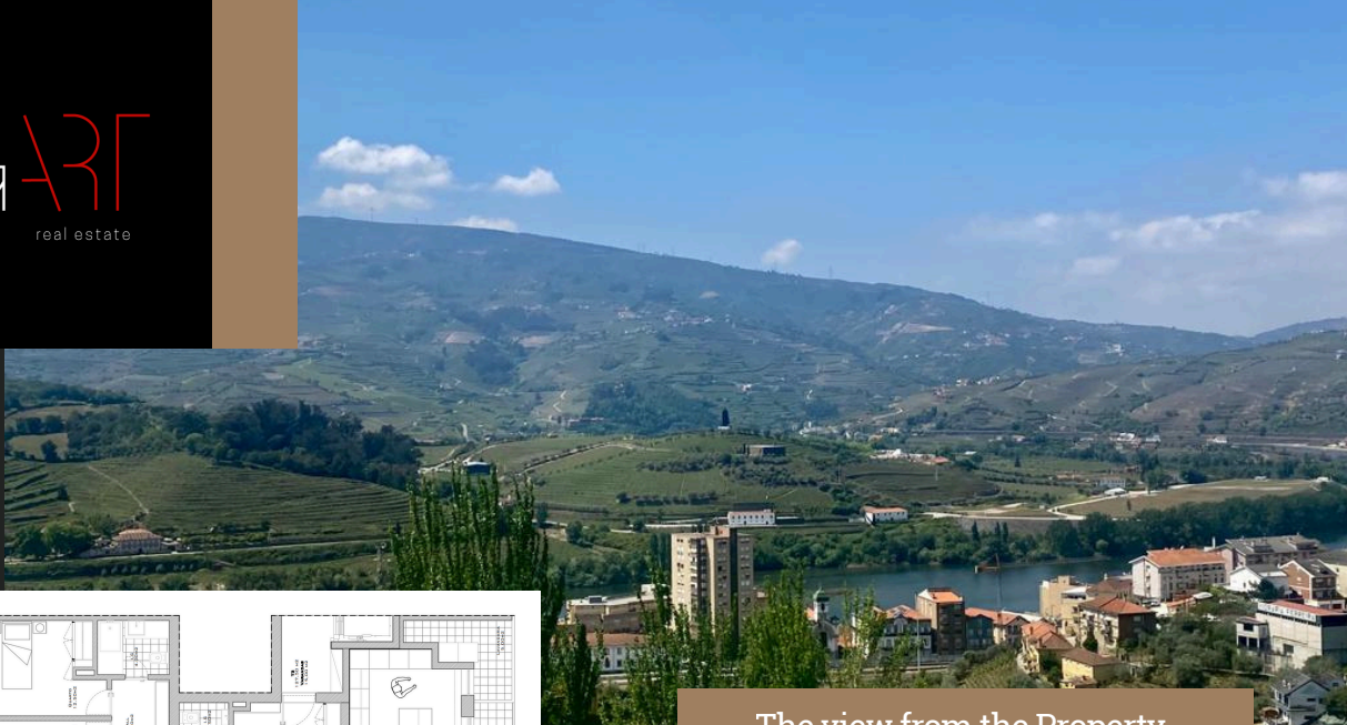
The view from the Property

Building with an incredible location - Douro Valley -