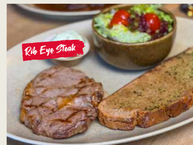
Rib Eye Steak