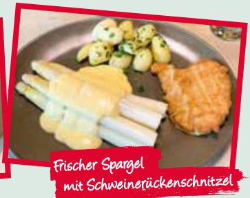
Frischer Spargel mit Schweinerückenschnitzel