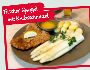
Frischer Spargel mit Kalbsschnitzel