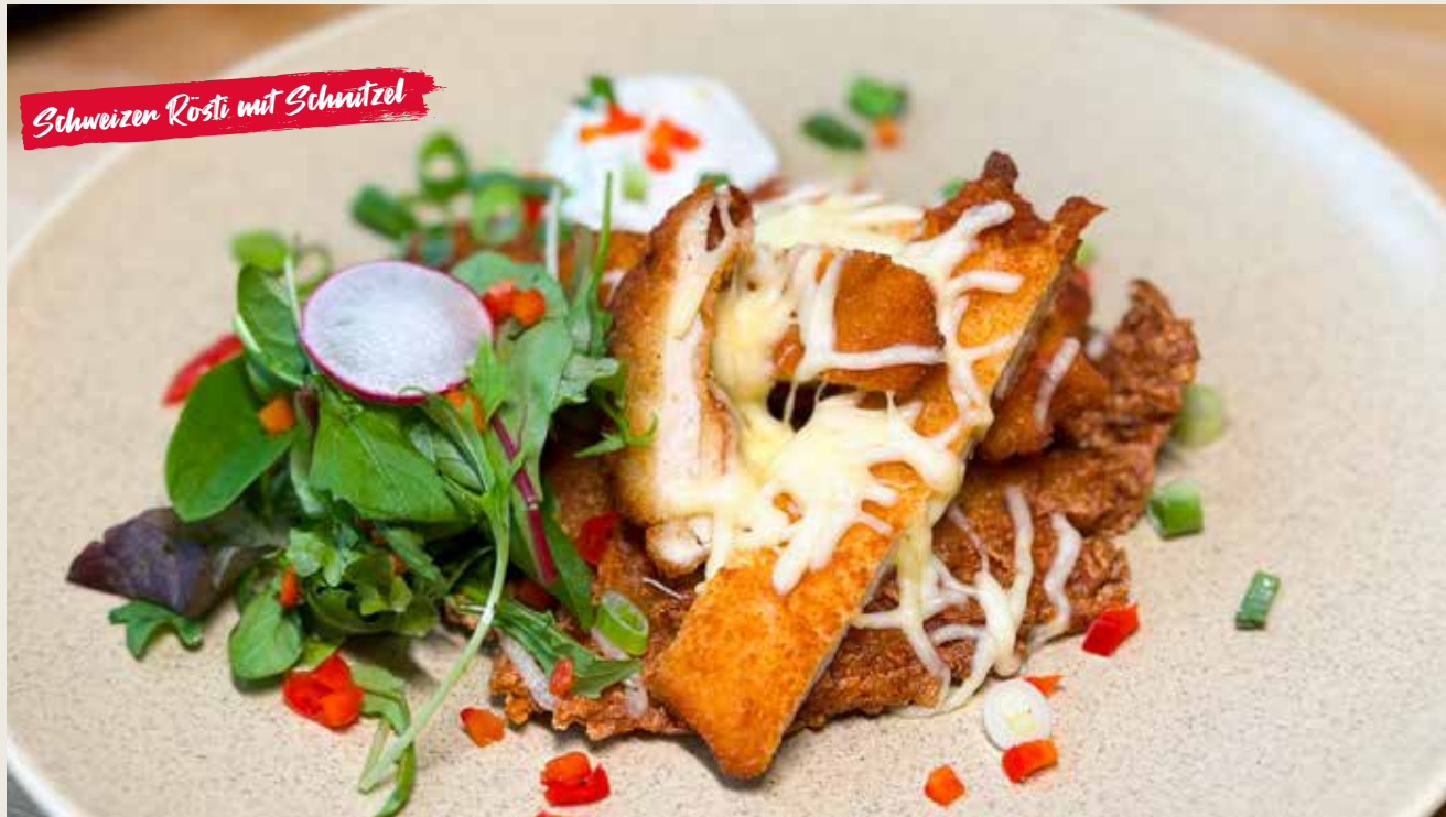
Schweizer Rösti mit Schnitzel