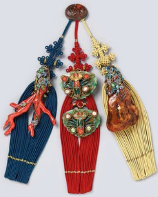
Norigae, Anhänger mit drei Ornamenten