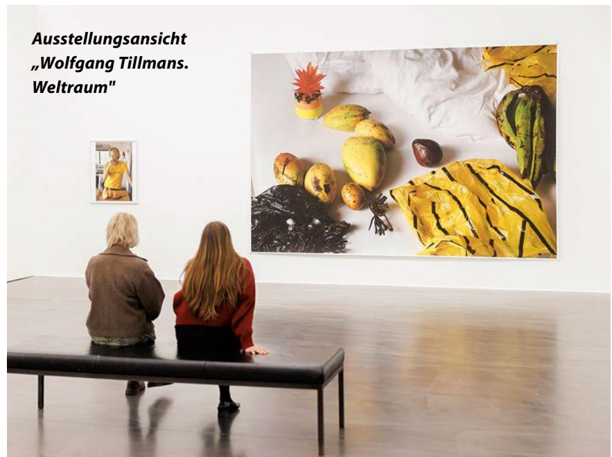
Ausstellungsansicht „Wolfgang Tillmans. Weltraum“