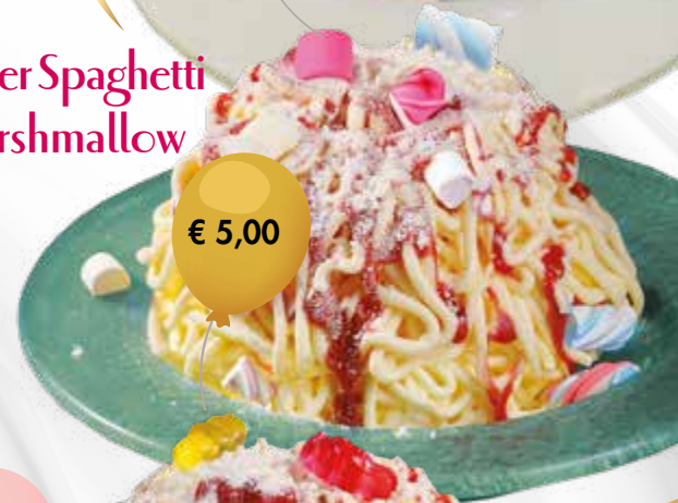
Kinder Spaghetti Marshmallow