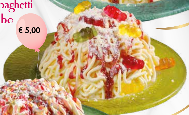
Kinder Spaghetti Haribo