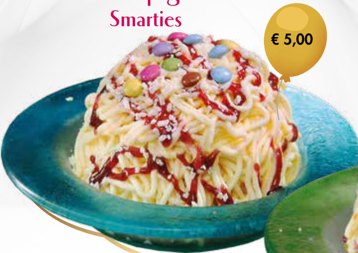
Kinder Spaghetti Smarties