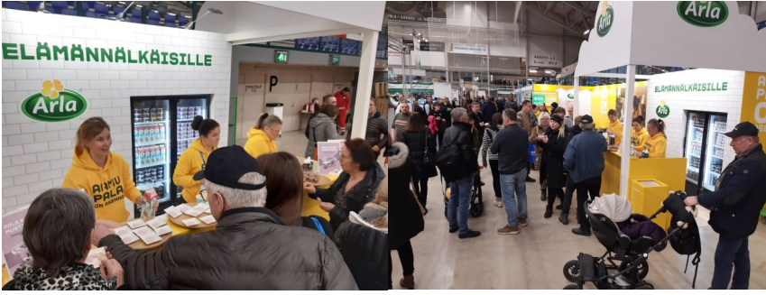
Särkänniemi messut Seinäjoella tammikuun lopulla olimme Arlan osastolla.