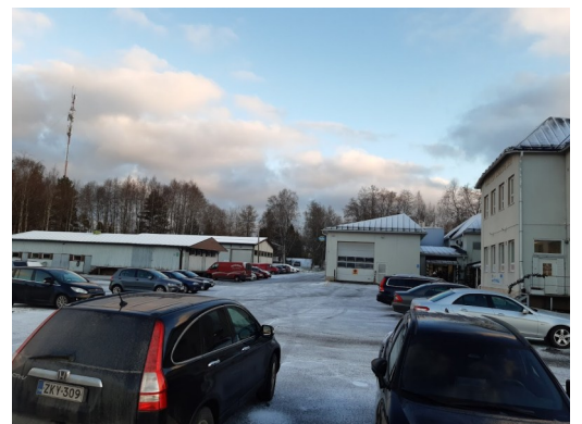
Meijerin Perinteisillä Joulumarkkinoilla riitti vilskettä ja puuroa oli tarjolla kaikille.