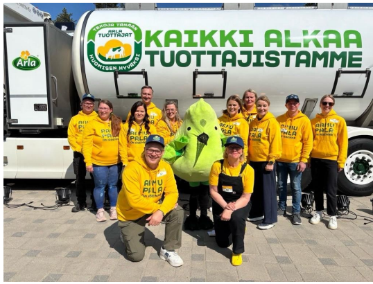
Kesäkuussa oli Arlan yhteistyöryhmän perhepäivä Ranuan eläinpuistossa.