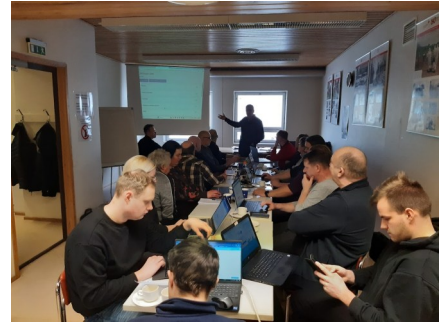
Koulutus kiinnosti tuottajia.