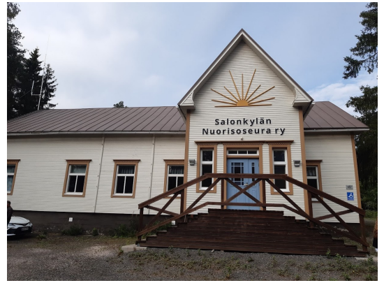
Kaustisen Osuusmeijerin 120 vuotisjuhlaa juhlittiin elokuussa teatterin ja hyvän ruoan merkeissä Salonkylän Nuorisoseuran talolla.