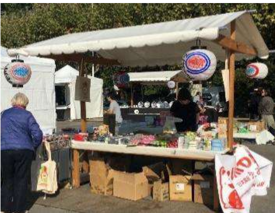
Référence : Stand en bois

En cas de pluie, si vous utilisez une tente à la place du stand en bois initialement prévu, un supplément de prix vous sera facturé en fonction de la taille de la tente utilisée. Nous vous remercions de votre compréhension.