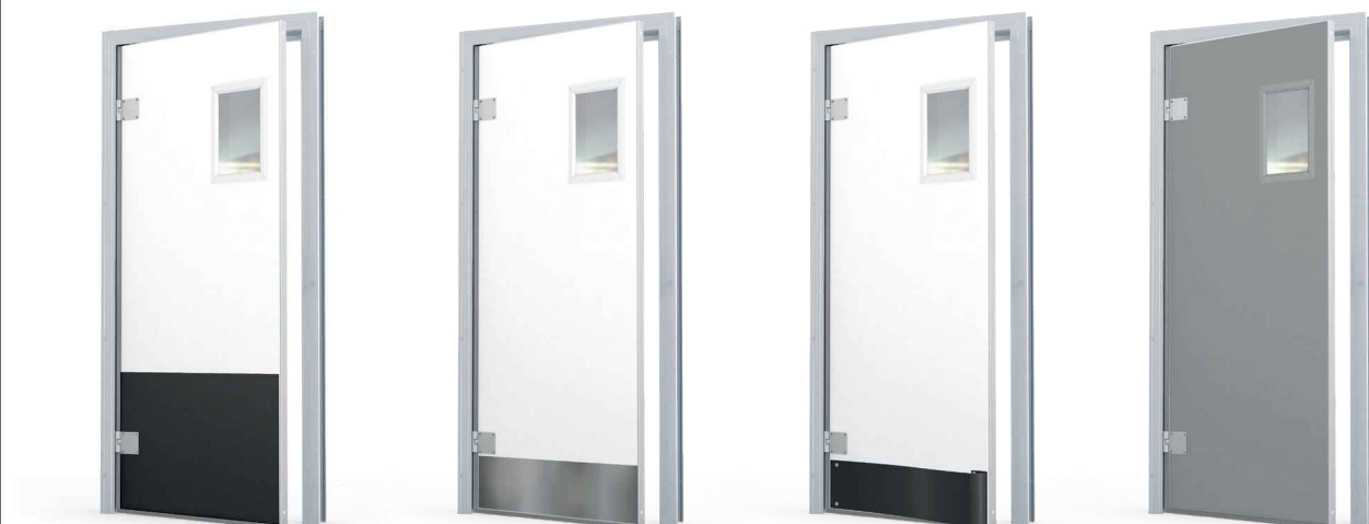
Polykarbonaatti-potkulevy 625 mm