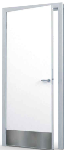
RST-potkulevy 250 mm