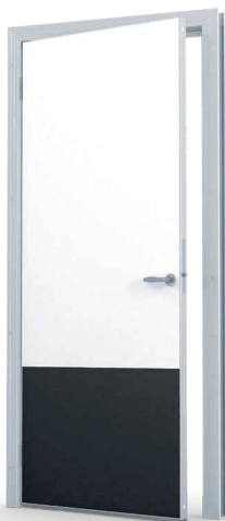
Polykarbonaatti-potkulevy 625 mm