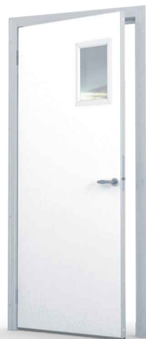
Ikkuna 240x400 mm