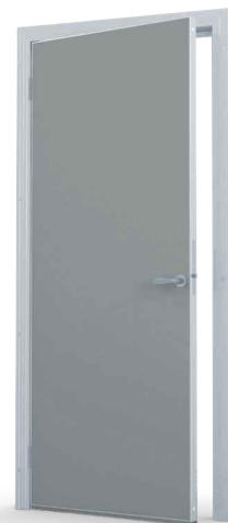
Väri RAL 7004