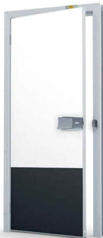
Polykarbonaatti-potkulevy 625 mm