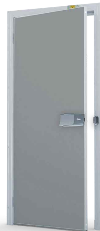
Väri RAL 7004