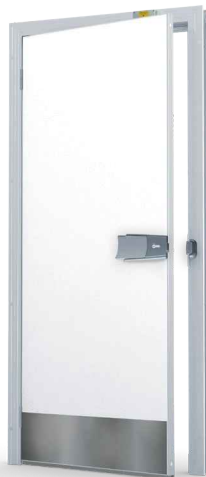
RST-potkulevy 250 mm