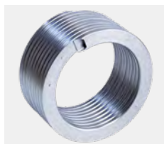
Vitoladens : échangeur de chaleur Inox-Radial en acier inoxydable austénitique