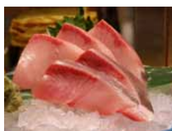
205. Seriole (8pcs) Hamachi (8pcs) Chf 18.00