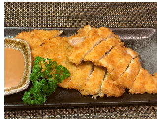
Poulet pané tonkatsu 18.00 chf