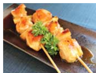
154. Brochettes De Poulet Yakitori (2pcs) Chf 8.00