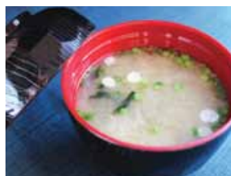
151. Soupe De Soja Et Tofu Miso Soup Chf 5.00