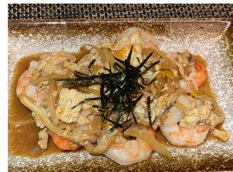
Crevettes don oignons 20.00 chf