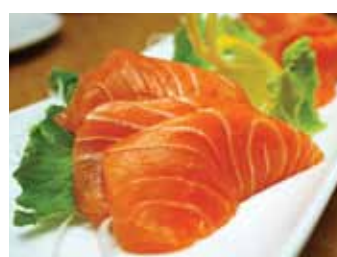
201. Saumon Sake (8pcs) Chf 16.00