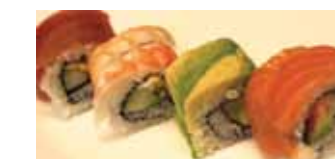
405. Melanger Mixed Chf 18.00

Avec Concombre et avocat (8pcs) California Roll (8pcs)