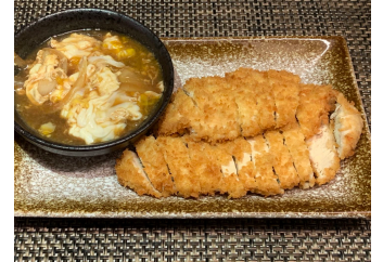
Poulet pané sauce oignons 18.00 chf