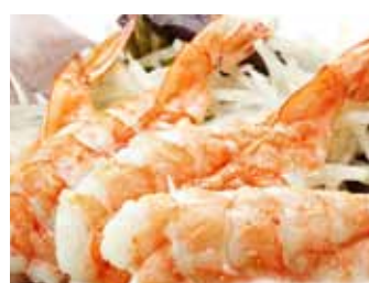
207. Crevettes Crues (10pcs) Ama Ebi (10pcs) Chf 12.00