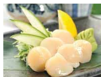
209. Noix De Saint-jacques (4pcs) Hotate (4pcs) Chf 12.00