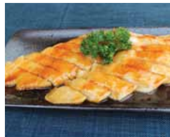
532 poulet Chf 18.00