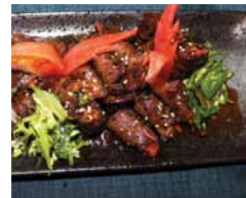
535. Rouleau De Boeuf Gyu Roll Chf 25.00