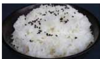
591 Riz blanc Chf 3.00