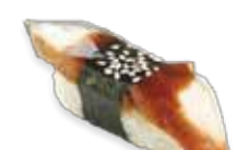
308. Anguille Fume Unagi Chf 3.50