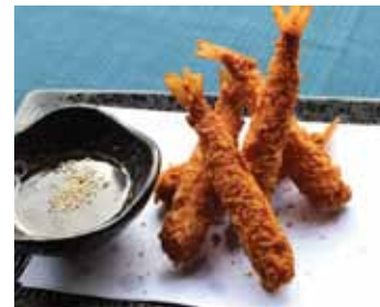
522. 5pcs Crevettes Panees 5pcs Ebi Fry Chf 16.00