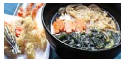
566 Udon Au Soupe Et Petit Tempura Tempura Udon Chf 18.00