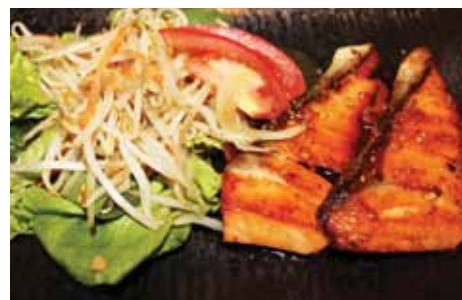
551. Saumon Sake Chf 22.00