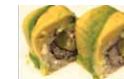
404. Avocat Abokado Chf 14.00