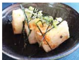
153. Tofufrit Agedashi Tofu Chf 7.00