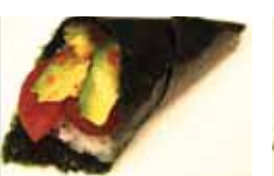
452. Thon Et Avocat Maguro Abokado Chf 9.00