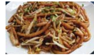
564. Udon Sautees Au Legumes Yasai Yaki Udon Chf 15.00