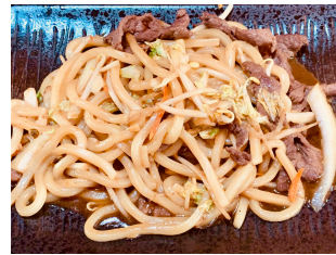
563. Udon au bœuf 20.00 chf