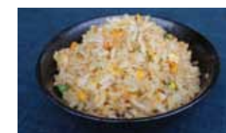
592 Riz saute chf 5.00