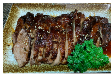
Canard teriyaki 20.00 chf