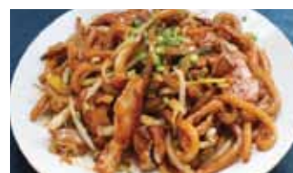
561. Udon Sautees Au Poulet Tori Yaki Udon Chf 18.00