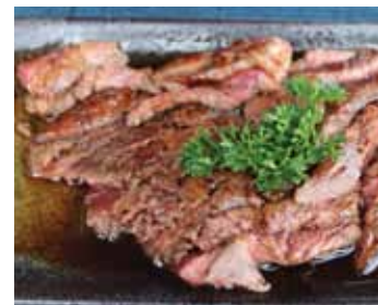
533. Steak De Boeuf Gyu Steak Chf 22.00