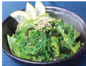
103. Salade D'algues Goma Wakame Salada Chf 6.00