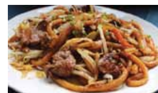
563. Udon Sautees Au Boeuf Gyu Yaki Udon Chf 20.00