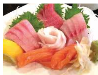
211. Sashimi Moriawase (18pcs) Assortiments De Sashimi (18pcs) Chf 35.00 212 Sashimi Moriawase (9pcs) Assortiments De Sashimi (9pcs) Chf 20.00