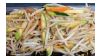
571. Légumes Yasai Chf 8.00