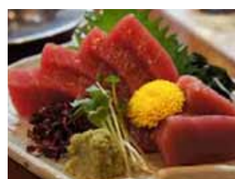
203. Thon Maguro (8pcs) Chf 18.00