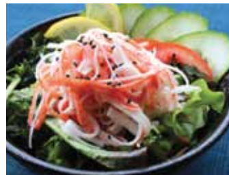
104. Salade De Crabe Kani Salada Chf 8.00