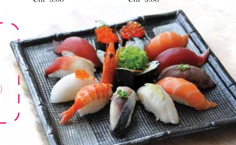
317. Assortiments De Nigiri Sushi (6pcs) Nigiri Sushi Moriawase (6pcs) Chf 18.00