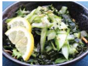
101. Salade Concombre Et D'algues Wakame Salada Chf 5.00