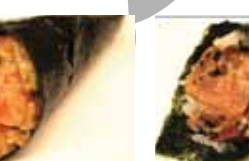
454. Salmon Epice Et Avocat Spicy Sake Abokado Chf 9.00