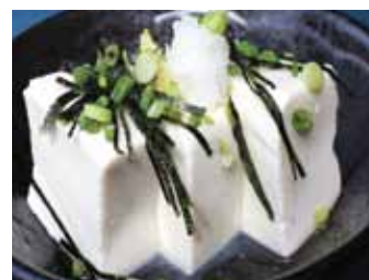
106. Tofu Froid Hiya-yakko Chf 5.00