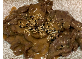
Bœuf sauce sésame 20.00 chf