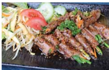
554. Rouleau De Boeuf Gyu Roll Chf 28.00