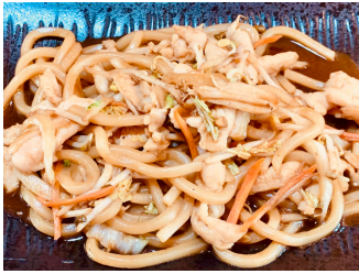
561. Udon au poulet 18.00 chf