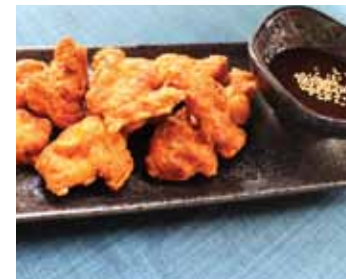
523. Poulet Frite Tori Karage Chf 18.00