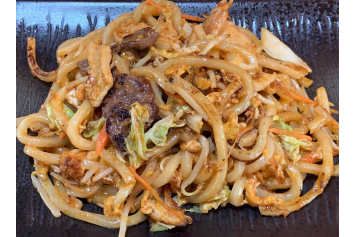
Udon Façon malaisienne 20.00 chf