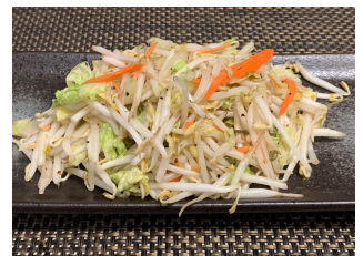
Légumes sautés 8.00 chf