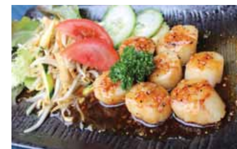
556. Noix De St-jacques Hotate Chf 25.00