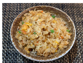
Riz sauté 5.00 chf