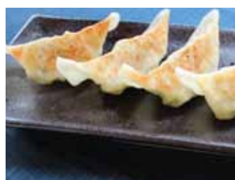
155. Raviolis Japonais Au Viande Gyoza (5pcs) Chf 6.00