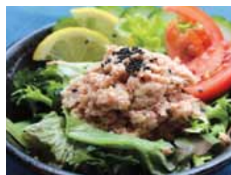
105. Salade Au Thon Maguro Salada Chf 8.00