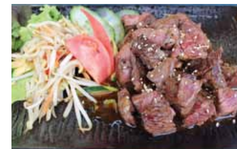
553. Steak De Boeuf Gyu Steak Chf 25.00