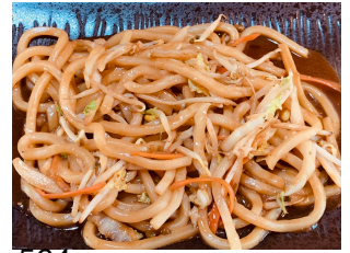
564. Udon au légumes 15.00 chf