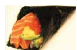
451. Saumon Et Avocat Sake Abokado Chf 8.00