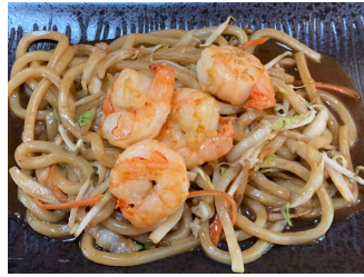
562. Udon au crevettes 20.00 chf