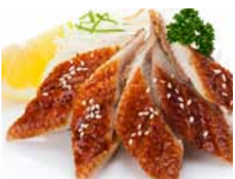
210. Anguille Fumee (4pcs) Unagi (4pcs) Chf 12.00