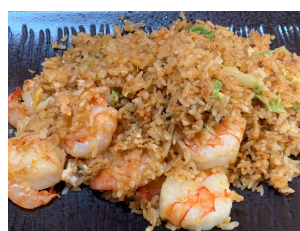
Riz sauté crevettes 20.00 chf