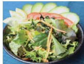
102. Salade Melee Yasai Salada Chf 5.00