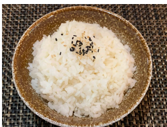
Riz nature 3.00 chf