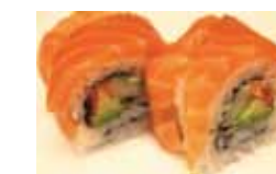
401. Saumon Sake Chf 16.00

Rouleau arc en ceil (8pcs) Rainbow Roll (8pcs)