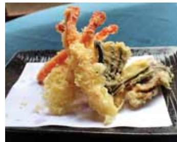
501. 5pcs Crevettes & 5pcs Legumes 5pcs Ebi & 5pcs Vege Chf 22.00