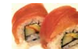
402. Thon Maguro Chf 18.00