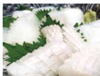
208. Seiche (10pcs) Ika (10pcs) Chf 12.00