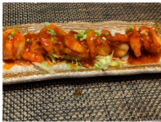
Crevettes sauce piment 20.00 chf