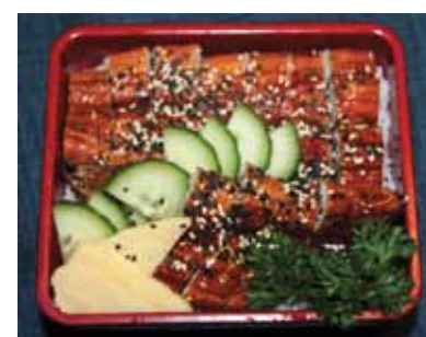
593 L'anguille Grille Sous Riz Unaju Chf 30.00