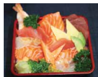
491. Poissons Crus Presentes Sur Un Bol De Riz Nama Chirashi Chf 35.00