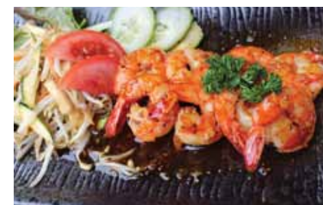
555. Crevettes Ebi Chf 25.00