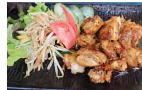
552. Poulet Tori Chf 22.00