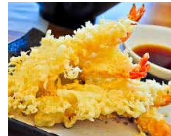
504. 5pcs Crevettes Tempura 5pcs Ebi Tempura Chf 16.00