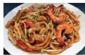
562. Udon Sautees Au Crevettes Ebi Yaki Udon Chf 20.00