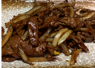
Bœuf don oignons 20.00