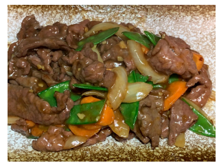
Bœuf Yakiniku 20.00 chf