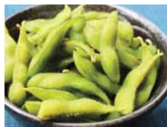
152. Graines De Soja Edamame Chf 5.00