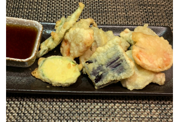
Légumes tempura 16.00 chf