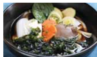
565. Udon Au Soupe Legumes Yasai Udon Chf 15.00