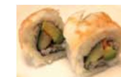
403. Crevette Cuite Ebi Chf 16.00