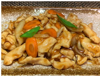
Poulet Yakiniku 18.00 chf