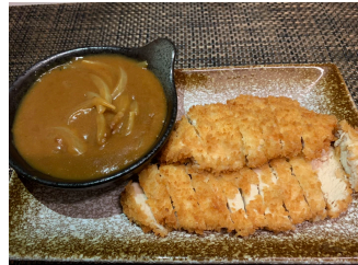
Poulet pané curry japonais 18.00 chf