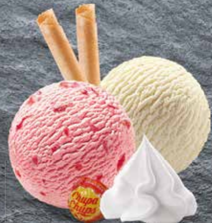
Bambini Vanille- und Erdbeer-Rahmglace mit Chupa Chups und Rahm CHF 6.50