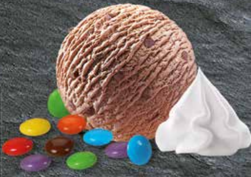
Billy Smarties Chocolat-Rahmglace mit Smarties und Rahm CHF 5.00