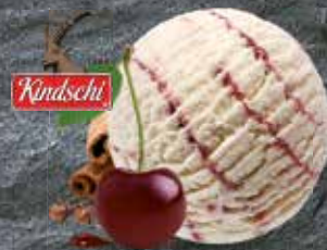
Röteli Kindschi Rahmglace