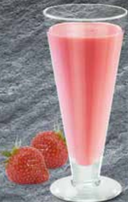
Frappé Aromen nach Wahl CHF 8.00