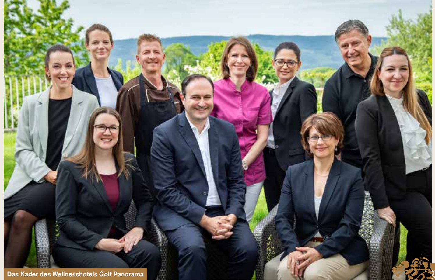
Das Kader des Wellnesshotels Golf Panorama

Kanton Thurgau für die Restauration. Zusätzlich ist er Prüfungsexperte für die Gastronomieausbildungen im Schulhotel Regina in Interlaken. Neben seiner Muttersprache Französisch und Deutsch spricht der dreifache Vater auch Englisch sowie Italienisch. Seine Hobbies sind nebst dem Reisen und der Hotellerie auch Kochen, Skifahren sowie das Wandern.