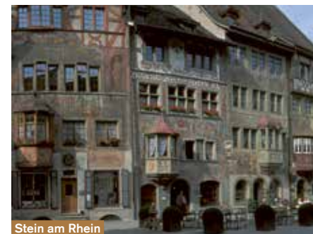
Stein am Rhein