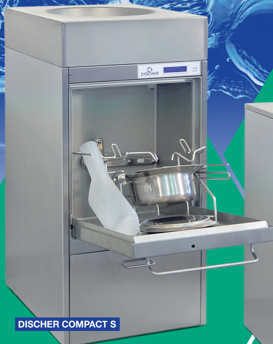
DISCHER COMPACT S

3 Standard A 0 -Werte 600/1000/3000 andere Werte frei einstellbar