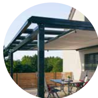
Wintergarten-Markisen Climara Unterglas

Die Unterglas-Markisen von WAREMA werden im Innenraum unter dem Glasdach angebracht und überzeugen vor allem als perfekter Licht-, Blend- und Sichtschutz. So genießen Sie ein angenehmes Klima, auch wenn draussen die Sonne brennt. Die attraktiven Unterglas-Lösungen von WAREMA bieten je nach Bedarf Abdunkelung oder Blendschutz und erhöhen die Wohnqualität Ihres Glasanbaus erheblich. Jetzt können Sie Ihren Wintergarten auch als Arbeitsplatz nutzen oder das Sonnenlicht dämpfen, wann immer Sie möchten. Das Premiummodell Climara W10 verfügt über die patentierte secudrive®-Technologie. Dabei wird die Markise über ein direkt am Markisentuch angebrachtes Federstahlband in der Schiene geführt. Durch die innovative Führungstechnik bleibt der Saum konstant gespannt und unerwünschte seitliche Lichtspalte gehören der Vergangenheit an. Dank einer Vielfalt an Design-Varianten, Farben und vielen Extras können Sie Ihren Wintergarten in eine Wohlfühloase verwandeln.