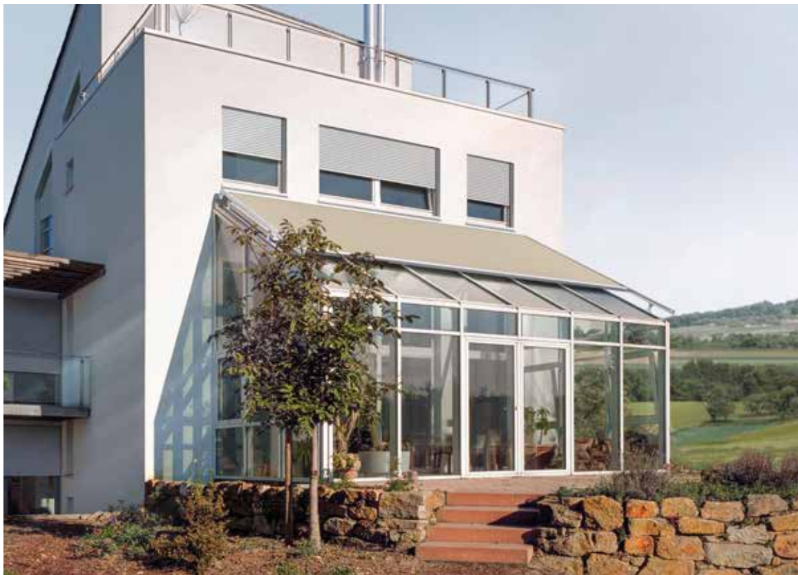
Wintergarten- Markise in rundem Design. Climara W19