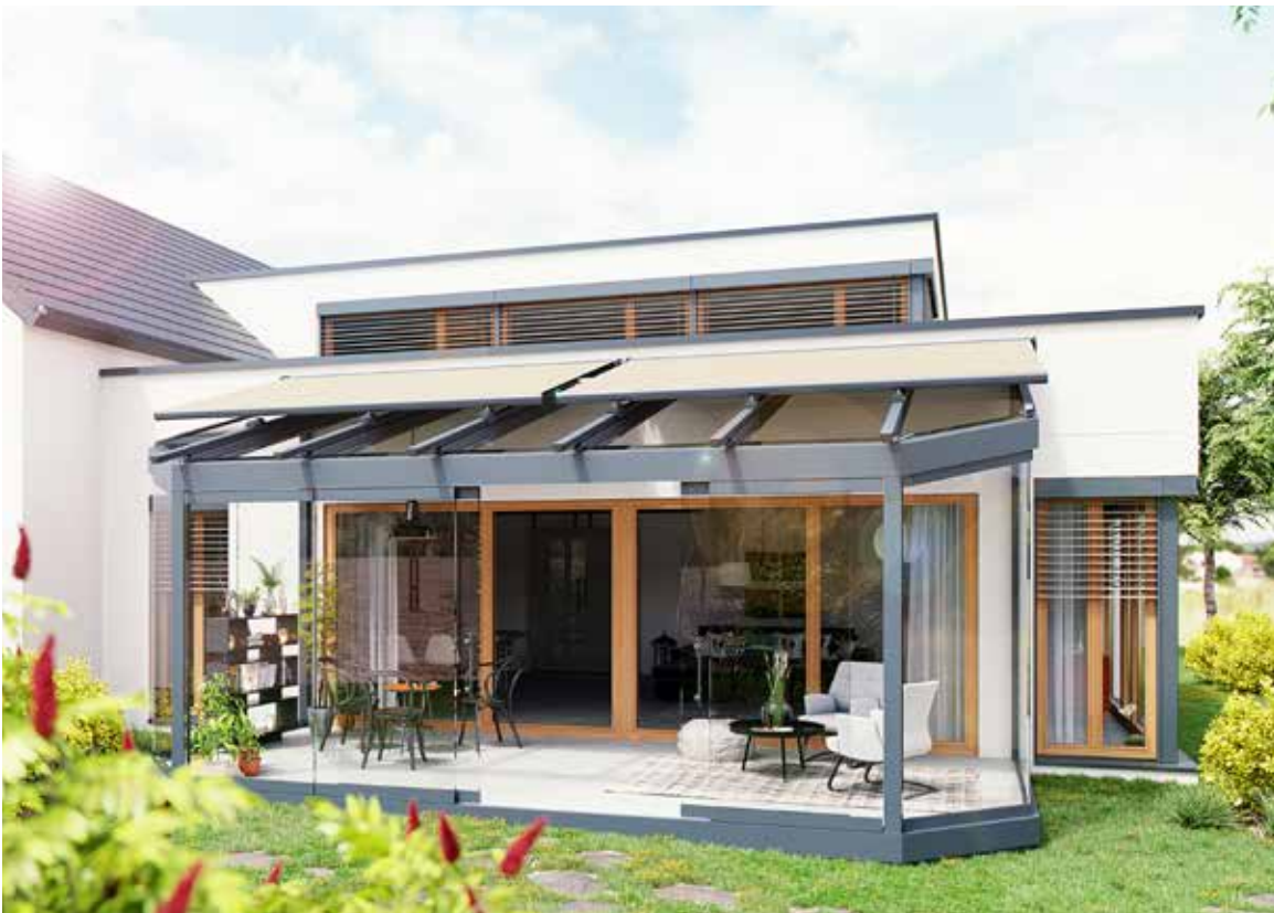
Bei abgewalmten oder abgeschrägten Glasflächen Climara W7