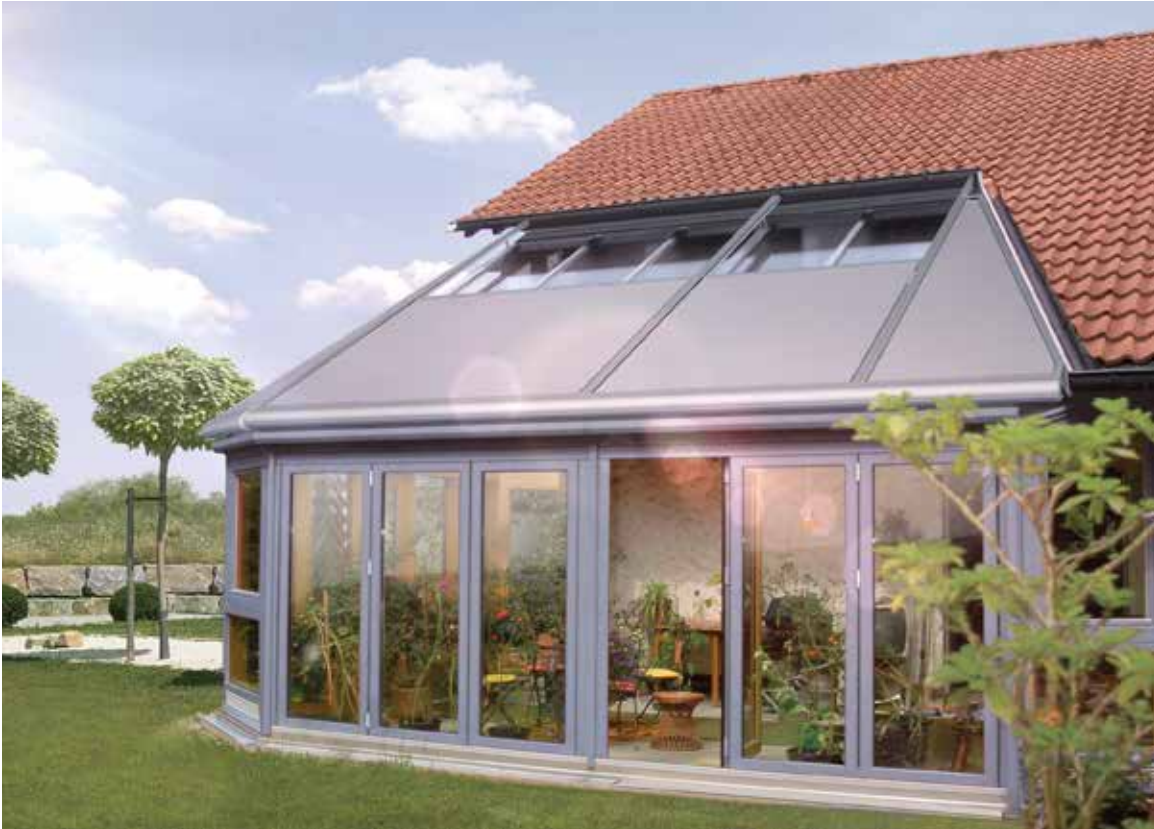
Bei dreieckigen oder trapezförmigen Glasflächen Climara D3