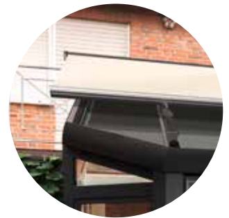
Climara für abgewalmte oder abgeschrägte Glasflächen

Auch für Wintergärten mit individuellen Formen (Dreiecke, Trapeze oder Walmdächer) hat WAREMA mit den Climara Markisen die optimale harmonische Lösung, wie beispielsweise die Dreiecksverschattung Typ D3. Das Resultat ist ein einheitliches, modernes Design.