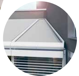
Climara für dreieckige oder trapezförmige Glasflächen