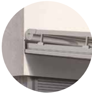
Rundes Design W19

Sie lieben die Natur, Ihren Garten und die frische Luft? Und möchten am liebsten alle Jahreszeiten hautnah erleben und geniessen? Überdachte Terrassen und Wintergärten erfüllen Ihnen diesen Wunsch. Sie erweitern Ihren Wohnbereich um einen besonderen Ort, der den Rundumblick nach draussen bietet und von wohltuendem Tageslicht erhellt wird. Besonders im Sommer kommt es darauf an, die grossen Glasflächen optimal zu verschatten, um ein angenehmes Raumklima zu erzeugen. Die ausserliegenden Climara Wintergarten-Markisen sind sehr widerstandsfähig und stabil konzipiert. Sie fangen den grössten Teil der Sonneneinstrahlung schon vor dem Glas ab, so dass die Wärme gar nicht erst ins Innere gelangt. Die hochwertigen Markisengewebe spenden nicht nur angenehmen Schatten, sondern sind durch ihre vielfältigen Farbmöglichkeiten auch gestalterische Elemente mit weithin sichtbarer Wirkung. Durch ihre Massanfertigung passen sie auch in speziell geschnittene Glasfassaden.