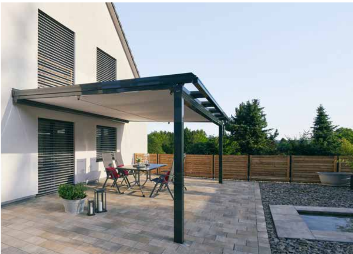
Klassische Markise mit optimierter Technik Climara W9