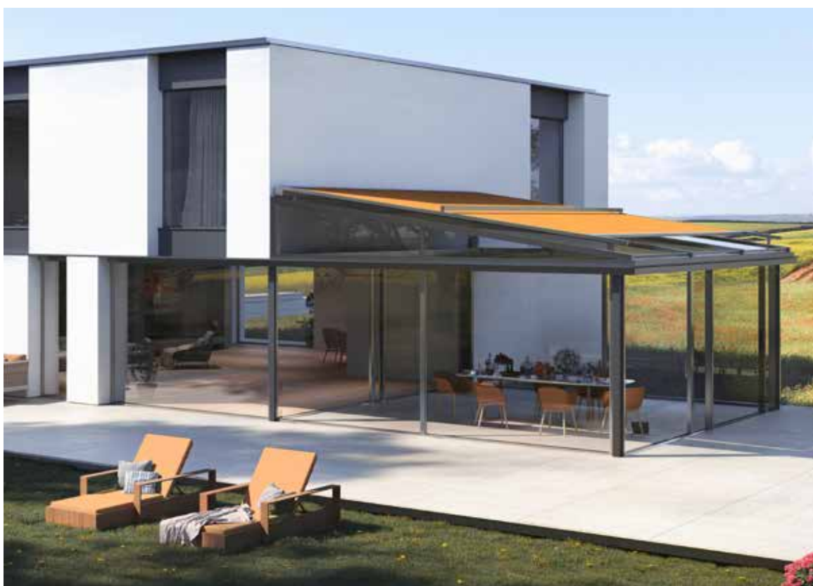
Aufglas Wintergarten- Markisen in kubischem Design. Climara W20