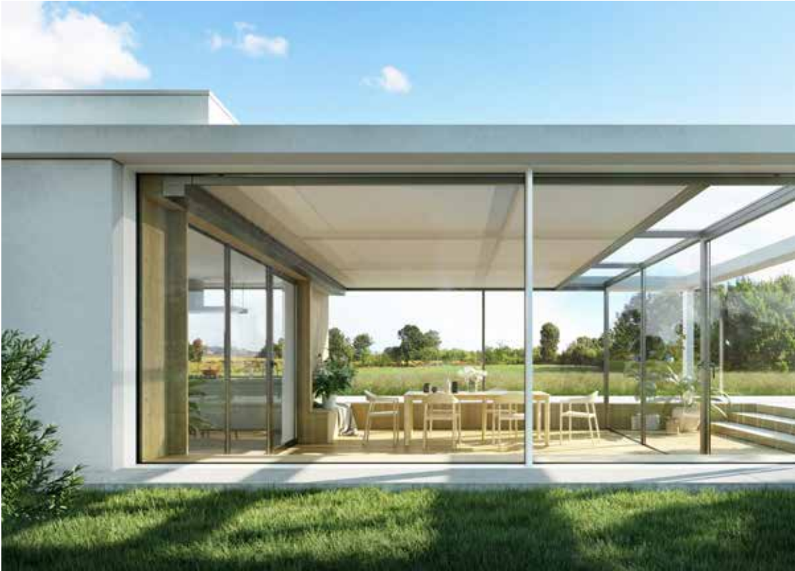
Premium- Markise mit secudrive®- Technologie und kubischem Design Climara W10