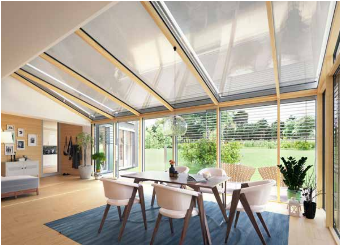
Klassische Wintergarten- Markise Climara W19