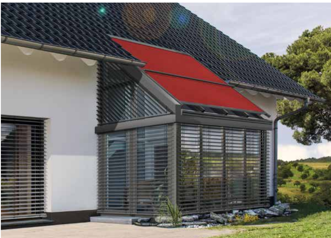
Premium- Wintergarten- Markise mit secudrive®- Technologie Climara W20