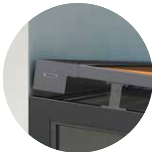
Kubisches Design W20