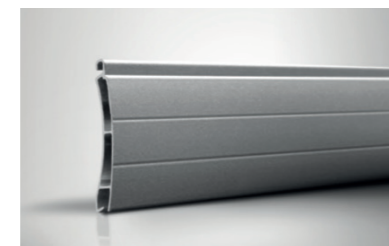
Magnum / Mini-Magnum