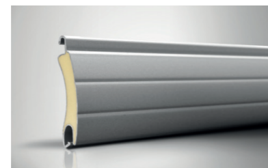
Oscar / Mini-Oscar RC 2