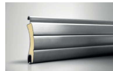
Bullit / Mini-Bullit RC 3

Unsere Sicherheitsrollläden sind für Alt- und Neubau geeignet und jederzeit nachrüstbar, auch wenn keine Sturzkästen vorhanden sind.