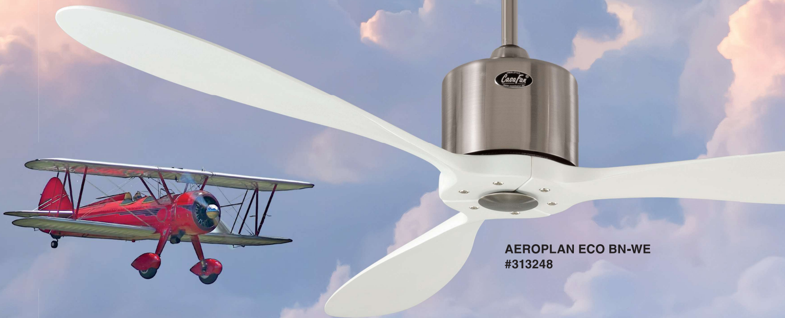
AEROPLAN ECO BN-WE #313248