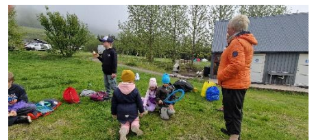
Vorferð yngsta stigs og leikskólans

Yngsta stig fór í sína árlegu vorferð ásamt elstu nemendum leikskólans þann 20.maí. Farið var í Tunguskóg á Ísafirði og nutu þau veðurbliðunnar þar. Farið var í leiki, vaðað í ánni og gengið um skóginn. Pylsur voru grillaðar áður en haldið var heim á leið.