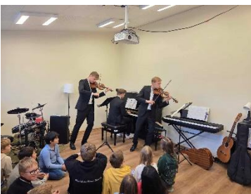
Frach bræður að spila

Nemendur á unglingastigi fóru í Grunnskólann á Ísafirði á fyrirlesturinn Fokk you-Fokk me.