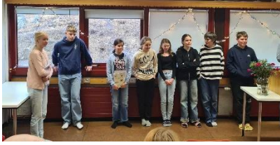
Upplestrarkeppnin á Þingeyri

Litla upplestrarkeppnin fór fram á Þingeyri í byrjun mars þar sem nemendur í 7. bekk frá Þingeyri og Suðureyri fluttu ljóð og sögur af einstöku kappi og áhuga . Einn nemandi frá Suðureyri ásamt einum nemanda frá Þingeyri tóku síðan þátt í stóru upplestrarkeppninni, fyrir hönd skólanna, sem haldin var á Ísafirði í sama mánuði.