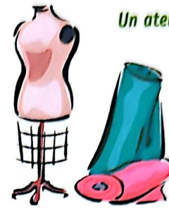
Un atelier de couture

Nous espérons que le nombre des participants nous permettra de démarrer ces deux activités.