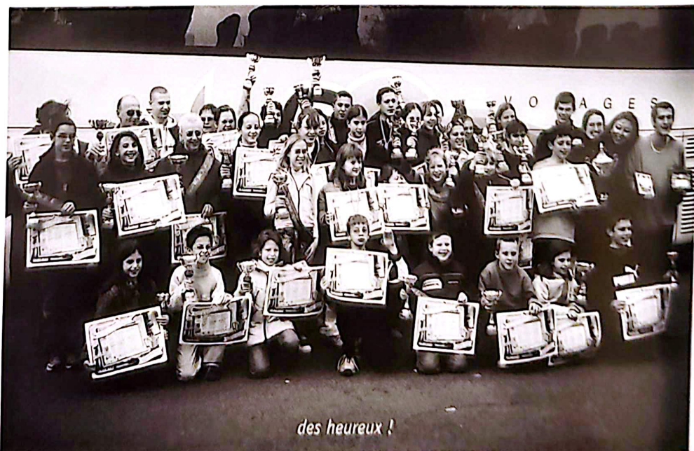
des heureux !

cette école crêchoise. En quatre ans, cette école de musique a ramené à Crêches trois champions d'Europe, trois vice-Champions d'Europe et deux médailles de bronze, le tout au plus haut niveau européen d'orgue ou d'accordéon.