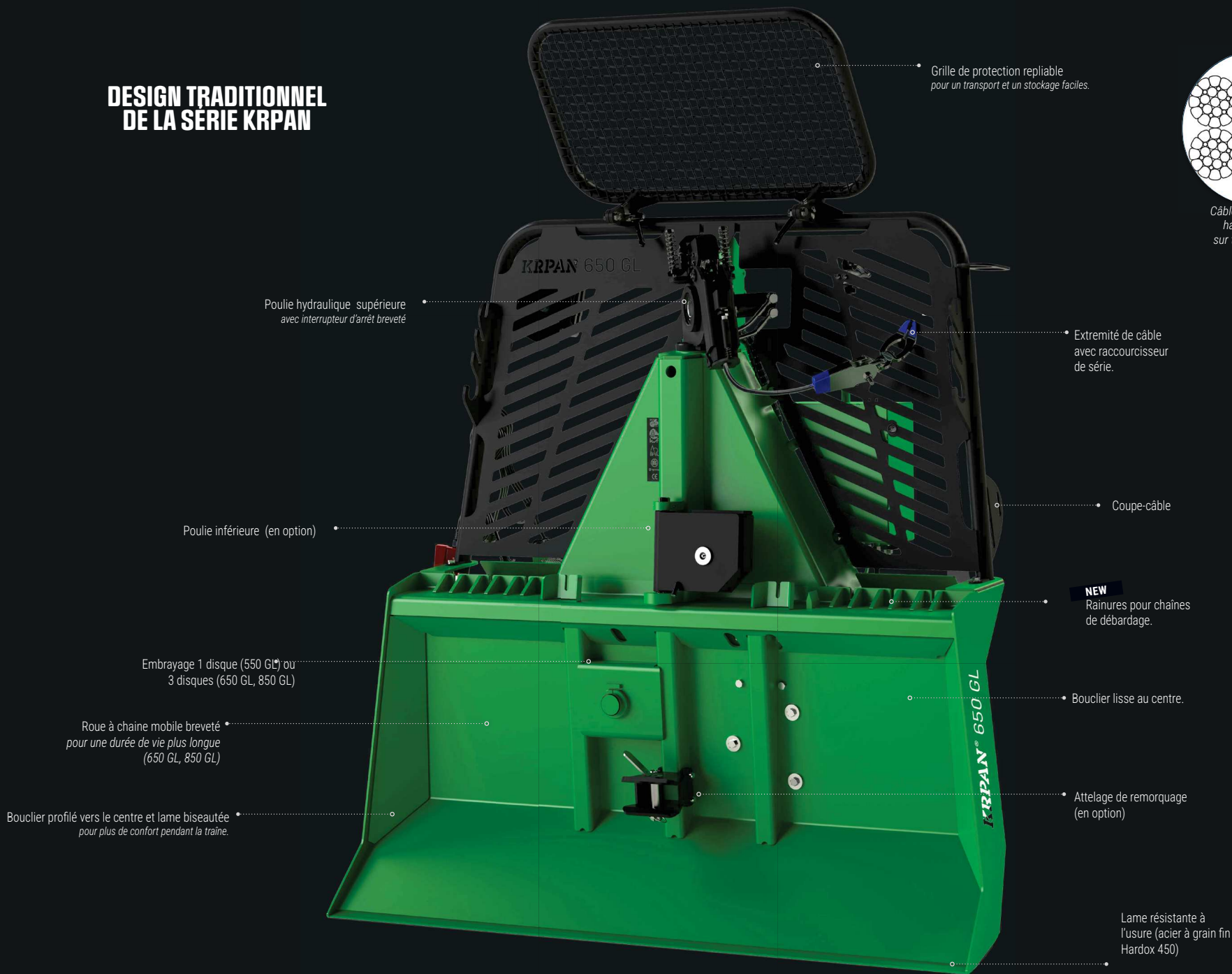
Grille de protection repliable pour un transport et un stockage faciles.