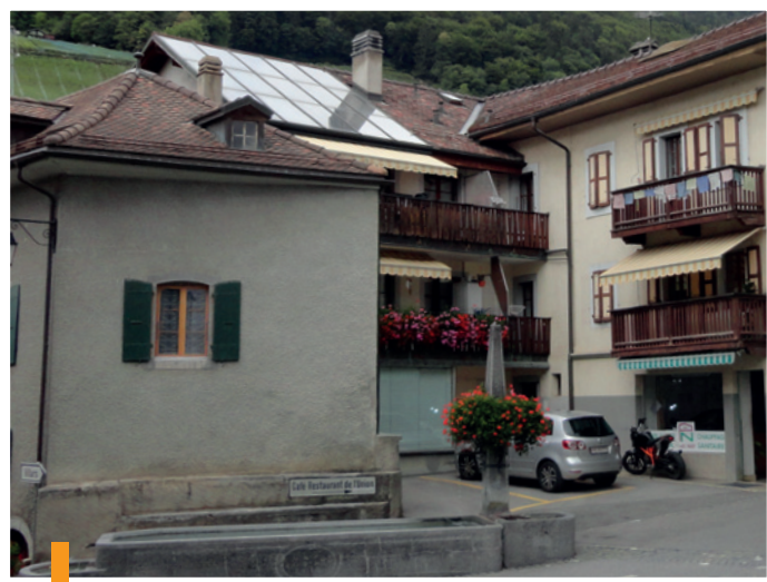
Installation effectuée en 1978 par Paul.NAEF, sur son bâtiment et toujours en fonction aujourd'hui