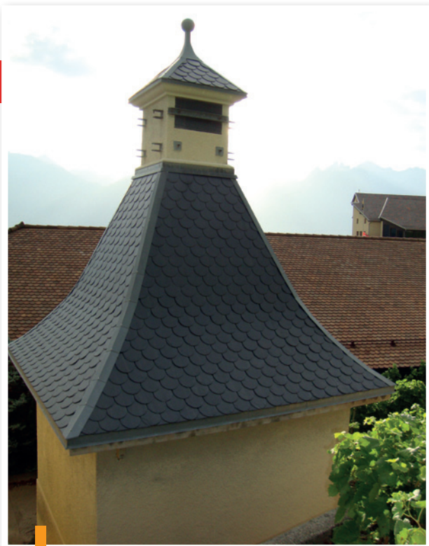
Réfection d'un toit en ardoise