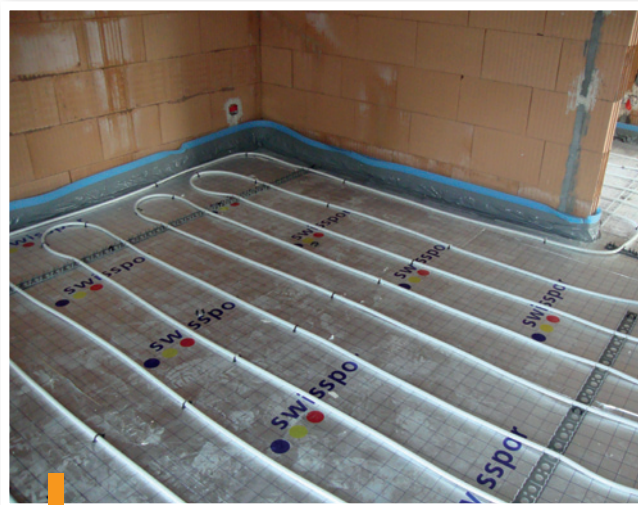
Chauffage au sol