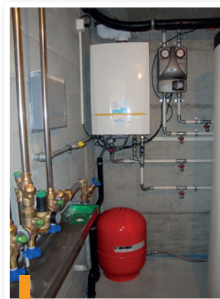
Chaudière à gaz