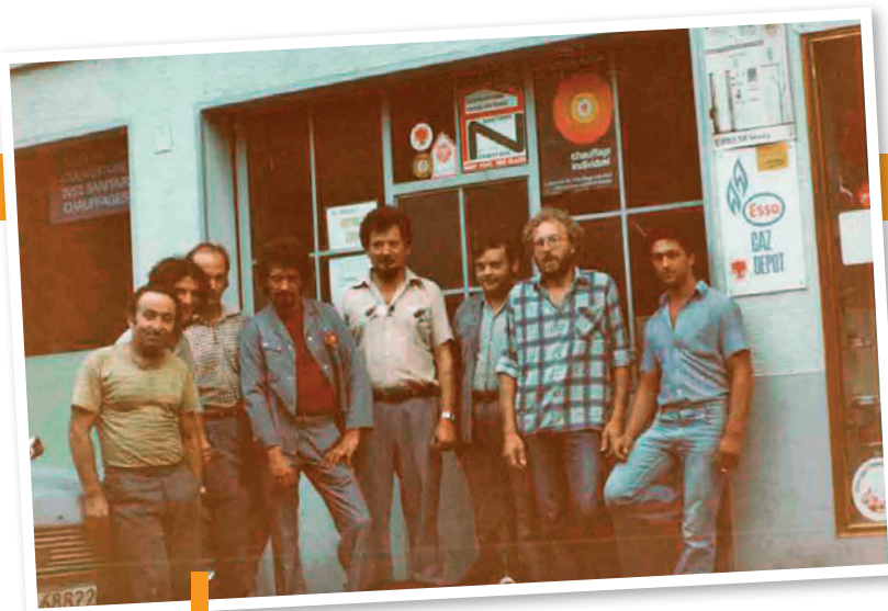
Devant l'atelier en 1982.

allaient prendre de plus en plus d'importance et de cette date à ce jour, ce ne sont pas moins de 150 villas et bâtiments qui ont été réalisés en matière de chauffage et d'alimentation en eau chaude, essentiellement sur le territoire communal. Pour parvenir à un tel résultat, l'entreprise Naef dut s'investir et participa notamment au Comptoir d'Aigle de 1996 à 2001 où tant les curieux que les intéressés pouvaient se familiariser avec les principes du chauffage à l'énergie solaire.