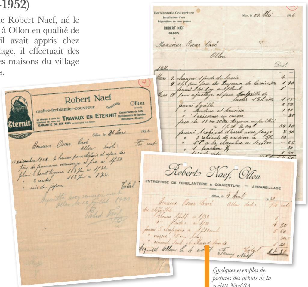
Quelques exemples de factures des débuts de la société NAEF SA.

Si l'augmentation paraît radicale, elle n'évolue plus guère, puisque des factures de 1927, 1930 et 1931 font état d'un prix identique.