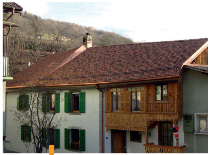
Exemple de toiture rénovée avant-après