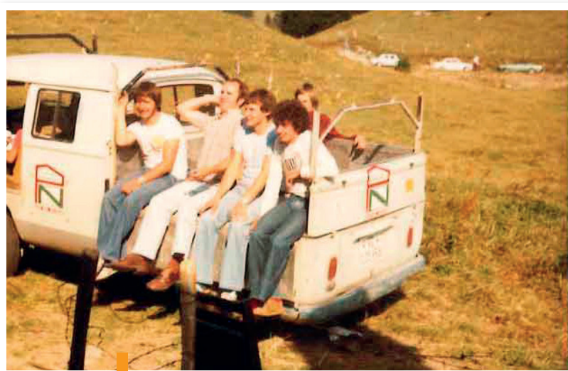
Dans le bus de la société en 1980.

Aujourd'hui centenaire, l'entreprise Naef tient à exprimer sa gratitude à tous ceux qui lui ont accordé et lui accordent encore leur confiance et les assurent de la poursuite de leur œuvre au service de la clientèle villageoise et chablaisienne avec le même souci professionnel et dans le respect de chacun.