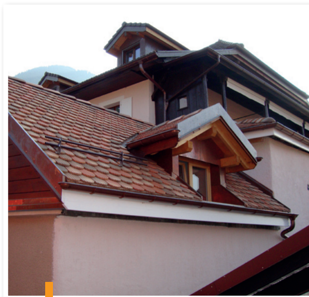
Création d'une lucarne et rénovation d'un toit