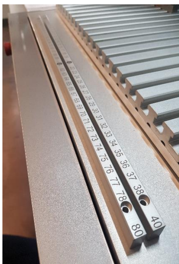
Graduation de numéros