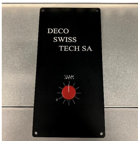
Potentiomètre gradué avec personnalisation