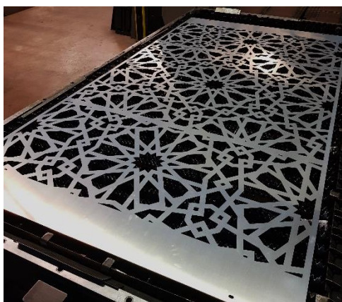
Découpe laser de panneaux personnalisés pour portails et barrières