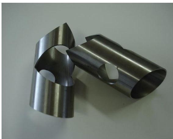
Découpe laser de tubes pour passage de câbles, pliage ou développement de barrière dans le domaine de la serrurerie

Évidemment, pour plus de photos et d'actualités, faites un tour sur nos réseaux sociaux.