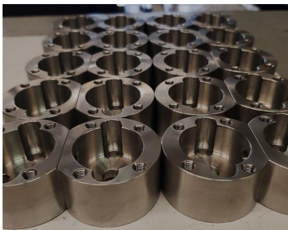
Usinage complet de pièces rondes, reprisent en fraisage

Évidemment, pour plus de photos et d'actualités, faites un tour sur nos réseaux sociaux.