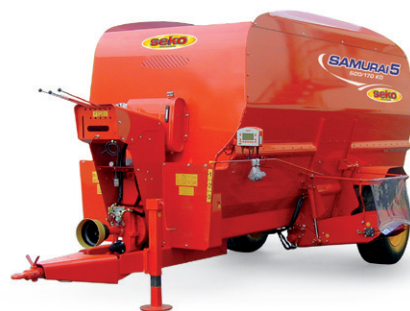
Seko Samurai vaakaruuvaunut