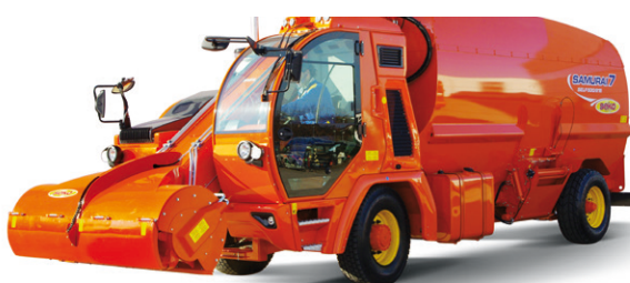
Seko ajettavat vaunut