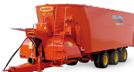
Seko Tiger ja Tuareg pystyruuvaunut