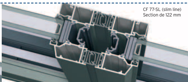
CF 77-SL (slim line) Section de 122 mm