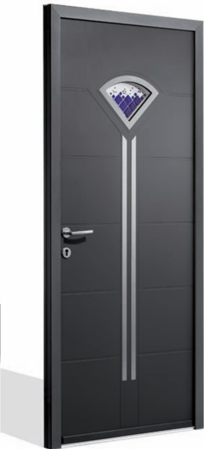
TURQUOISE 3 Vitrage sablage uni Gris 7035. Poignée baton BT9 600 mm. Ud 1,5