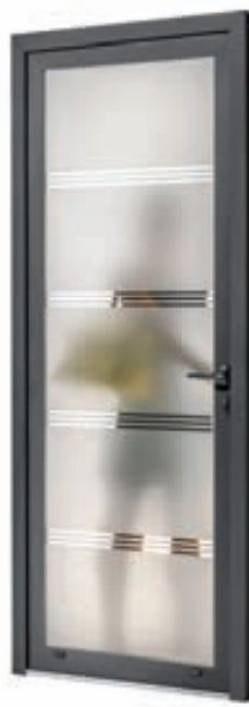
SALOUM Décor sablé Ud 1,9