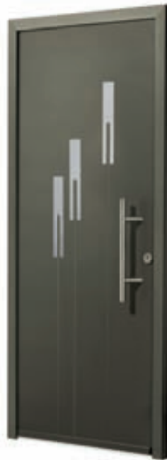
CYCLOPE Pièces métalliques affleurantes Poignée bâton BT9 600 mm Gris 2900 sablé Ud 1,3