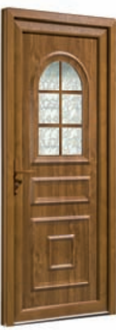
ANTARES 1L Antares 1L Delta clair Croisillons Chêne Doré Ud 1,5