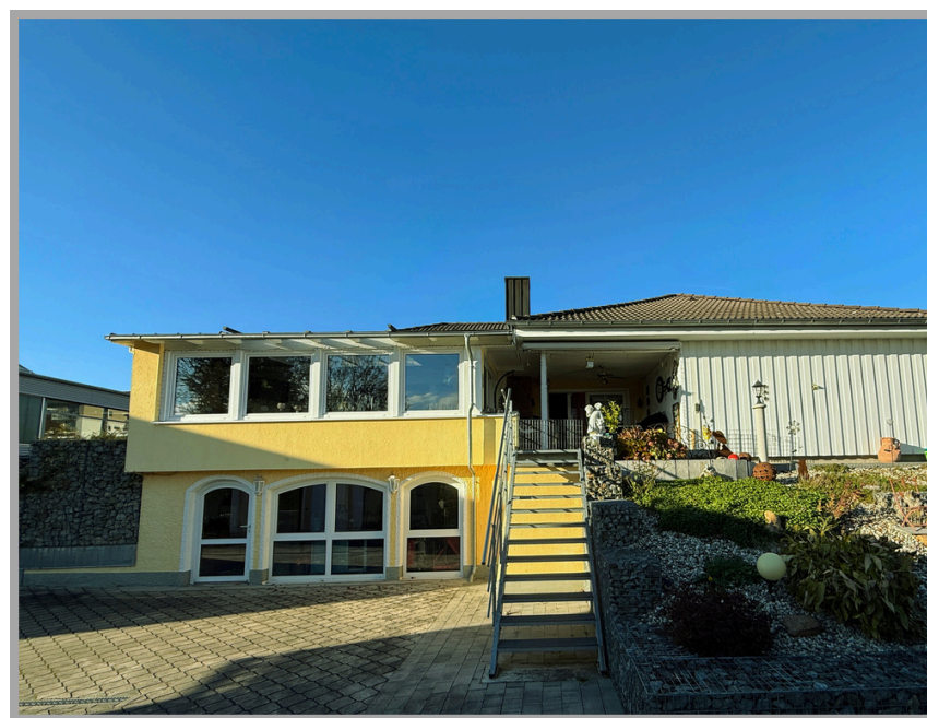
Ansicht aufs Haus Rückseite

Bundesland: Bayern Landkreis: Passau Gemeinde: Ruhstorf an der Rott Zum Ortskern: Ruhstorf 500 m Infrastruktur: Einkaufsmöglichkeiten, Ärzte, Apotheken, Kindergärten, Grund- und Mittelschule.