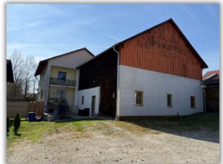
Ansicht auf Haus und Wintergarten

Neugierig geworden? Wir freuen uns auf Ihre Anfrage.