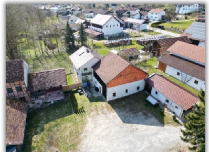
Ansicht auf Haus und Wintergarten