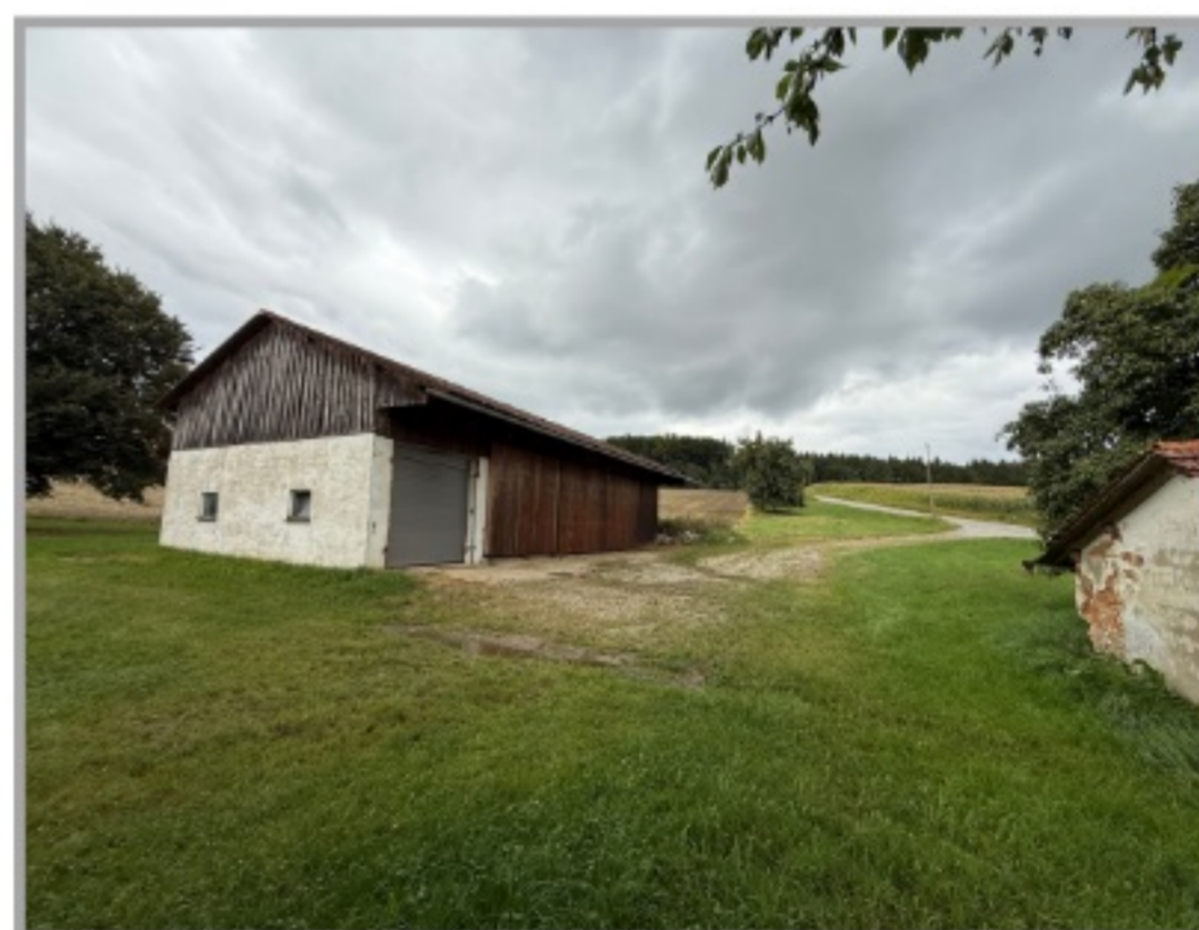
Ansicht auf Maschinenhalle

Grundfläche: ca. 24 ha Wohnfläche: ca. 181 qm Nutzfläche: ca. 2200 qm Kaufpreis: auf Anfrage € Baujahr Blockhaus: ca. 1890 Baujahr Stallung u Scheune: ca. 1986 Provision: 3,57% inkl. MwSt Energieausweis: Bedarfsausweis Energieträger: Holzöfen Energieeffizienzklasse: G Energiebedarf: 243,12 kWh/(m²*a) Ausstellungsdatum: 15.01.2026 Gültig bis: 15.01.2036