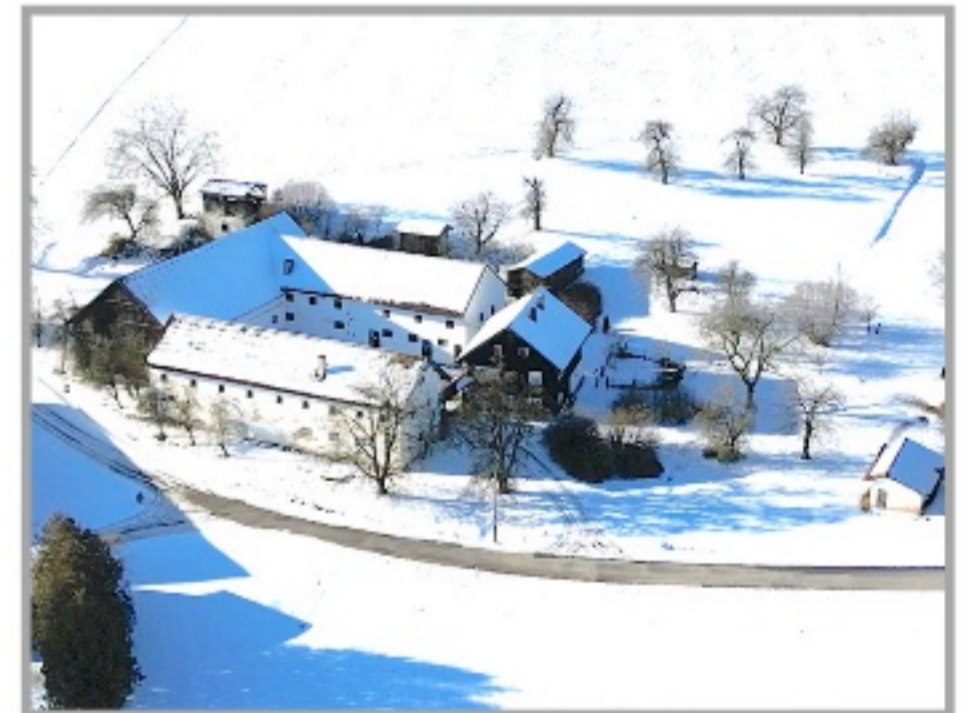
Luftaufnahme vom Vierseithof

Der zuständige Makler freut sich auf Ihre Anfrage und steht gerne auch telefonisch für Sie zur Verfügung!