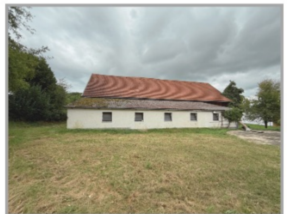
Ansicht auf Scheune