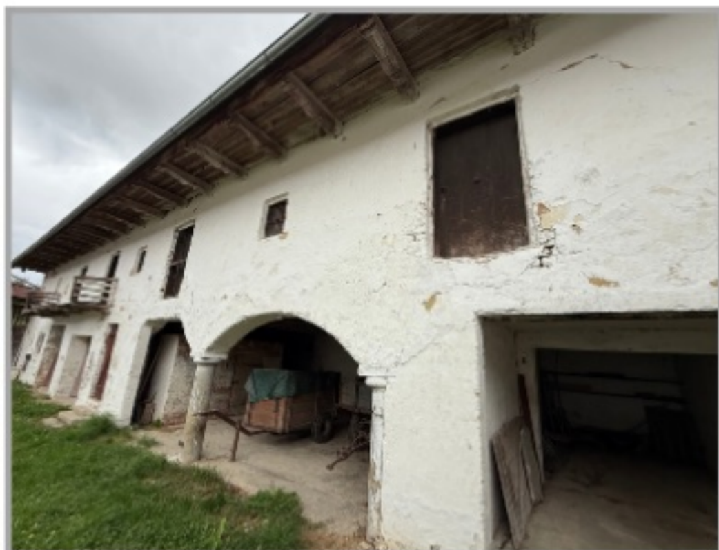
Blick auf das Nebengebäude