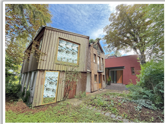
Ausbaupotential mit 2 Anbauten